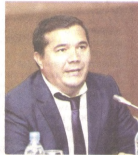
Как подчеркнул глава государства в ходе поздравительной речи, в жизни Узбекистана все

В течение всего декабря страна подвела итоги 2019 года. Достижений в экономике, общественной жизни, образовании, здравоохранении и культуре, произошедших за ушедший год, было много, но не время останавливаться на достигнутом. В праздничном новогоднем поздравлении Президент отметил, что в 2020-м курс на реализацию широкомасштабных реформ продолжится в еще более активном темпе.