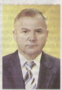
Записал С. Рахимов. Корр. УзА.

Хочу поздравить всех с Новым годом. Гостеприимному Узбекистану желаю процветания, а мудрому, доброму и трудолюбивому народу вашей страны - мира и благополучия!