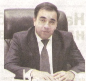
населения к получению государственных услуг, расширять гарантии надежной защиты прав и свобод граждан, повышать уровень их доступа к правосудию.

В рамках реализуемых реформ идет процесс формирования и развития правовых институтов, инструментов и методов их деятельности, а также современной правовой инфраструктуры, которые в наибольшей степени способны обеспечивать доступ