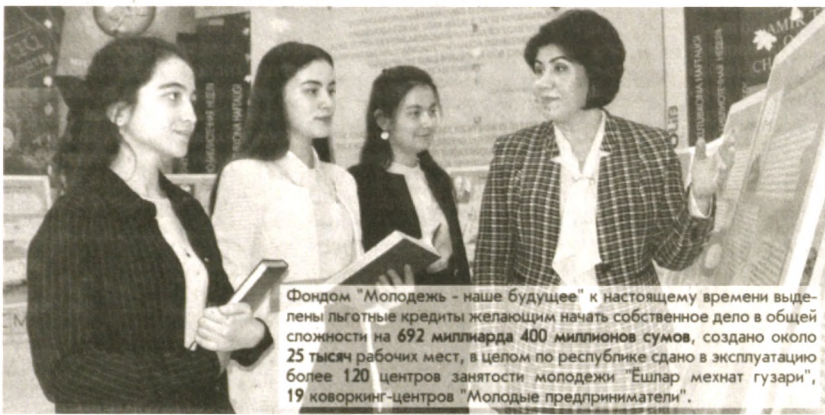
Фондом "Молодежь - наше будущее" к настоящему времени выделены льготные кредиты желающим начать собственное дело в общей сложности на 692 миллиарда 400 миллионов сумов, создано около 25 тысяч рабочих мест, в целом по республике сдано в эксплуатацию более 120 центров занятости молодежи "Ешлар мехнат гузарари", 19 коворкинг-центров "Молодые предприниматели".

1 ← Лидер страны обратился не только к собравшимся в зале, а к каждому из тех, кто в дальнейшем внесет вклад в развитие страны. Молодежи предстоит многое сделать, государство в свою очередь предоставит необходимые условия. В чем это выражается? В первую очередь в создании образовательной платформы современного уровня, которая объединяет открытые учебные заведения разных профилей. Причем речь идет об организации равных условий на территории всей страны. В Узбекистане также создаются возможности для раскрытия потенциала юношей и девушек, которые в количественном соотношении сегодня опережают другие категории населения. Так, Союз молодежи насчитывает 7 миллионов 690 тысяч членов. "Верю, что среди подрастающего поколения"