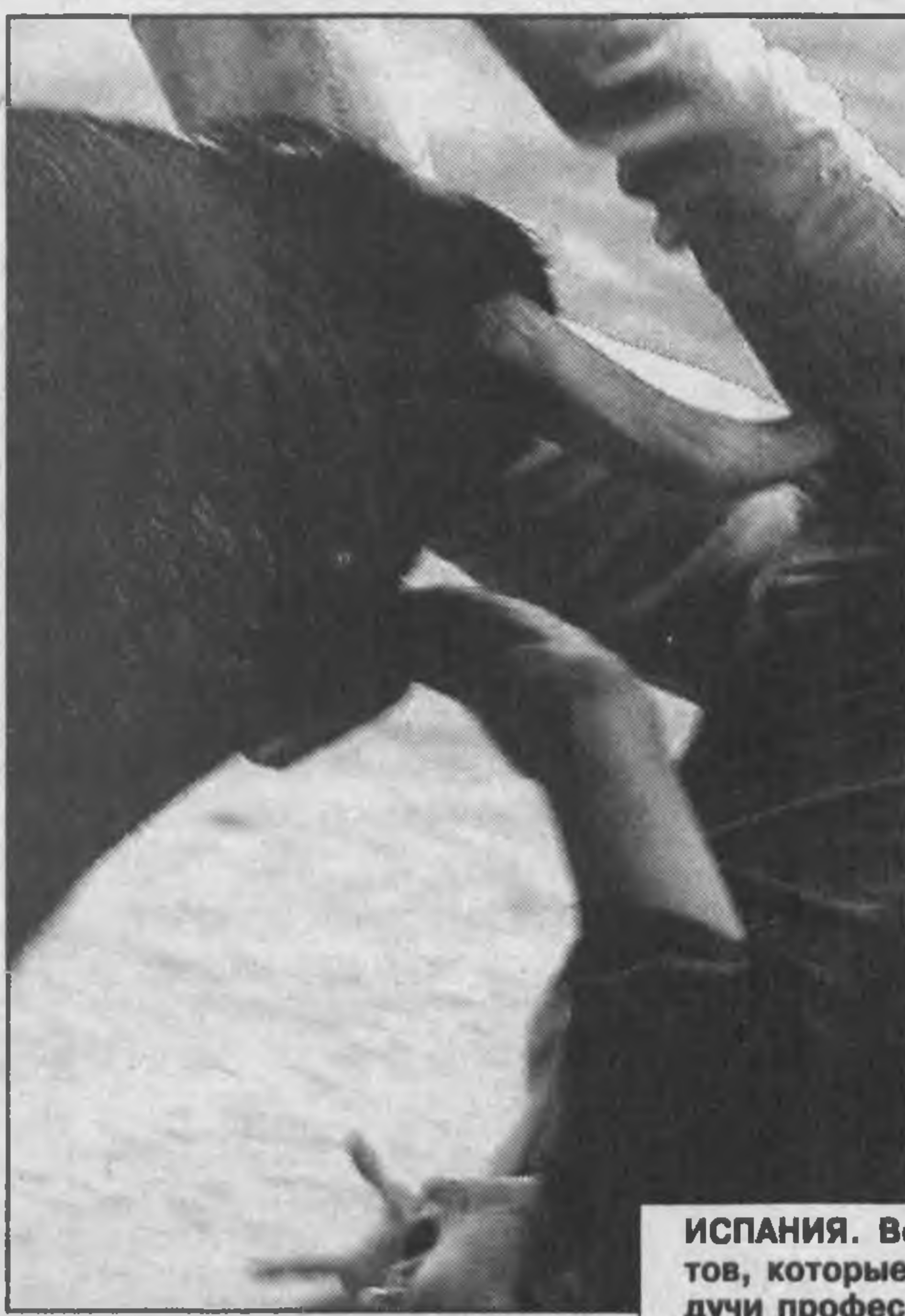
ИСПАНИЯ. Вот так бык поднимает на рога дилетантов, которые стремятся поиграть с животным не будучи профессиональными торрерами.

Согласно программе ООН по репатриации беженцев, к концу текущего года еще 170 тысяч беженцев вернутся в Анголу из Конго, Намибии и Замбии. Во время гражданской войны, продолжавшейся 30 лет, примерно четыре млн. ангольцев потеряли кров, 500 тысяч оказались в других странах и стали беженцами. После окончания боевых действий в апреле прошлого года обустройством беженцев и людей, потерявших кров, стало главной задачей ангольского правительства, прилагающего усилия к послевоенному восстановлению страны.