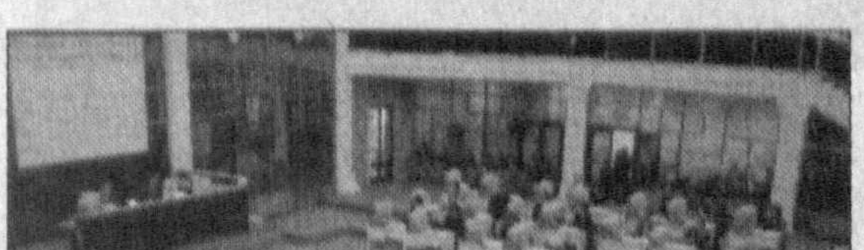
80 брокерских мест оснащены самой современной техникой фирмы «Siemens», что позволяет в перспективе иметь возможность доступа информации с ведущих товарных бирж СНГ, мира и коммерческих структур через международную сеть «Интернет».

Начал действовать программно-технический комплекс, включающий в себя электронную торговую систему товарам. В ближайшее время торги будут происходить одновременно на всех компьютерах, установленных в областных филиалах УзРТСБ. Тогда брокер или предприниматель не будет приезжать в Ташкент, чтобы получить информацию о выставленных товарах, а, находясь у себя в офисе, сможет участвовать на биржевых торгах через электронную почту и получать информацию по конкретным товарам.