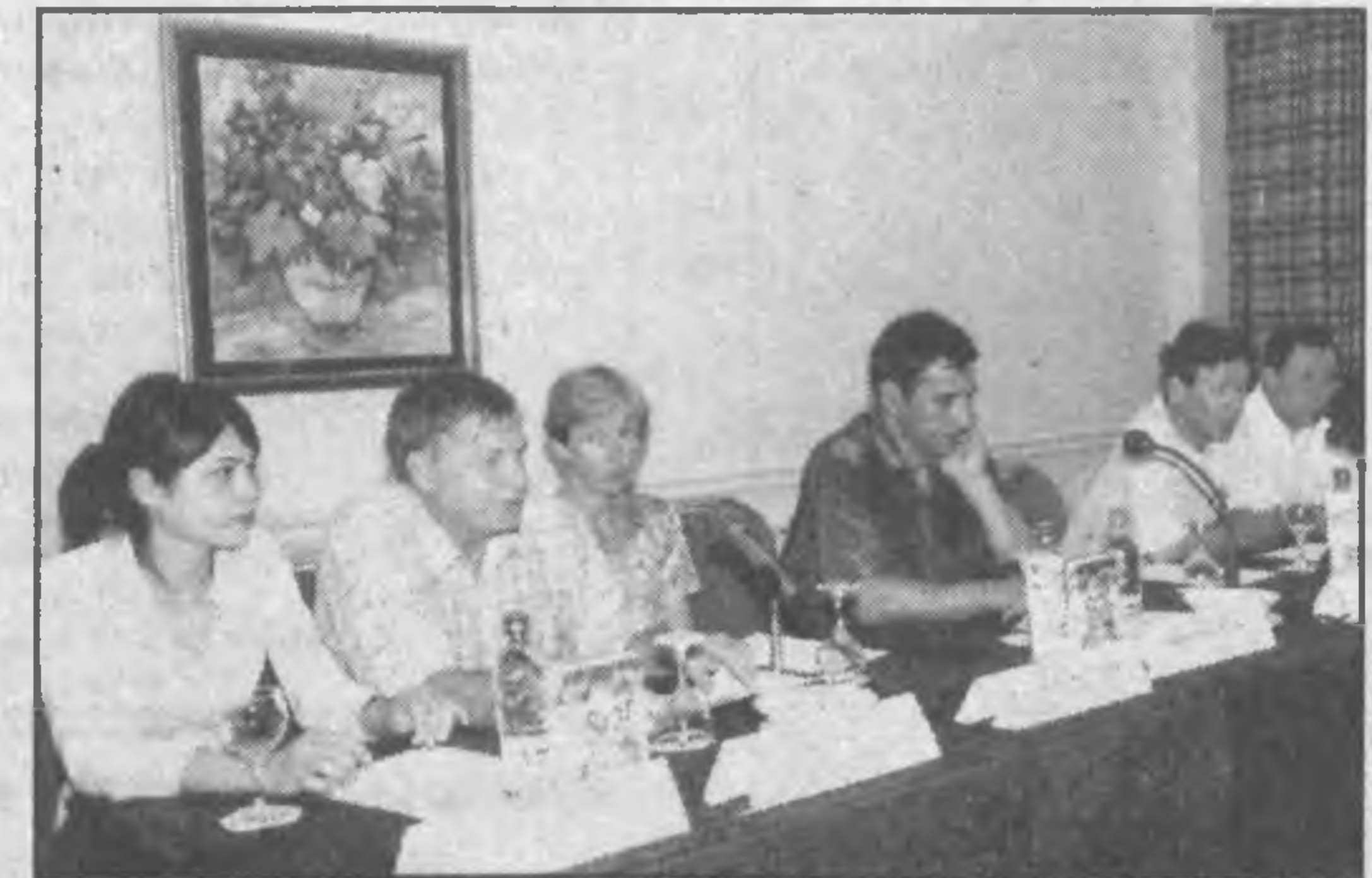
НА СНИМКЕ: участники восхождения на Ак-су дают пресс-конференцию перед отъездом в Кыргызстан.