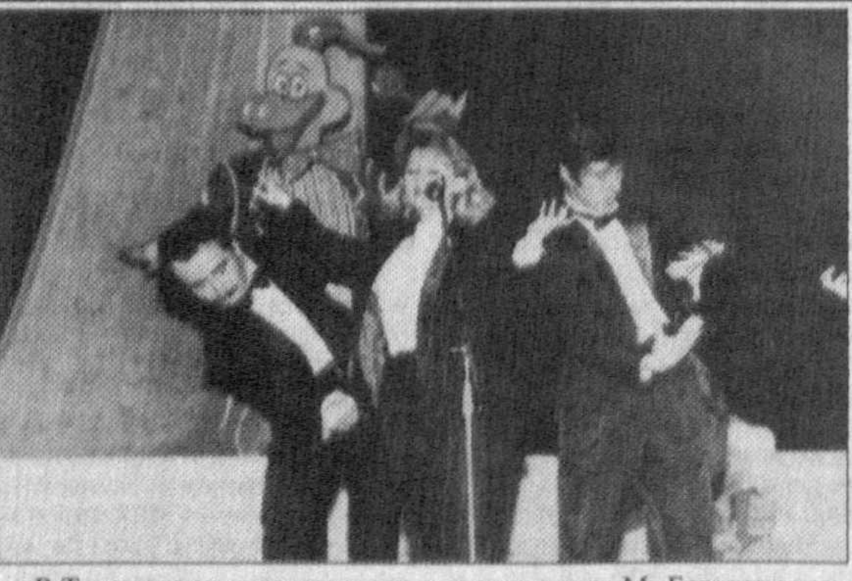
В Ташкентском драматическом театре имени М. Горького прошла встреча 1/8 финала клуба веселых и находчивых. Во встрече приняли участие столичная и несколько областных команд.

«Последний император» Бертолуччи — уже не последняя сенсация. Отшумели аплодисменты, поставлены на полки «Оскары». Разве о произведении такого уровня можно когда-нибудь сказать: анализ завершен, все пласты вскрыты? Каждый видит свое, слышит струны собственного сердца, затронутые фильмом. Кинокритики, ярые поклонники таланта блестящего итальянского мастера, просто кинозрители почувствовали в нем грандиозную проблему, которая в последнее время всколыхнула наше с вами общество и на Востоке и, не в меньшей мере, на Западе: Человек и Система, Личность и Государство.