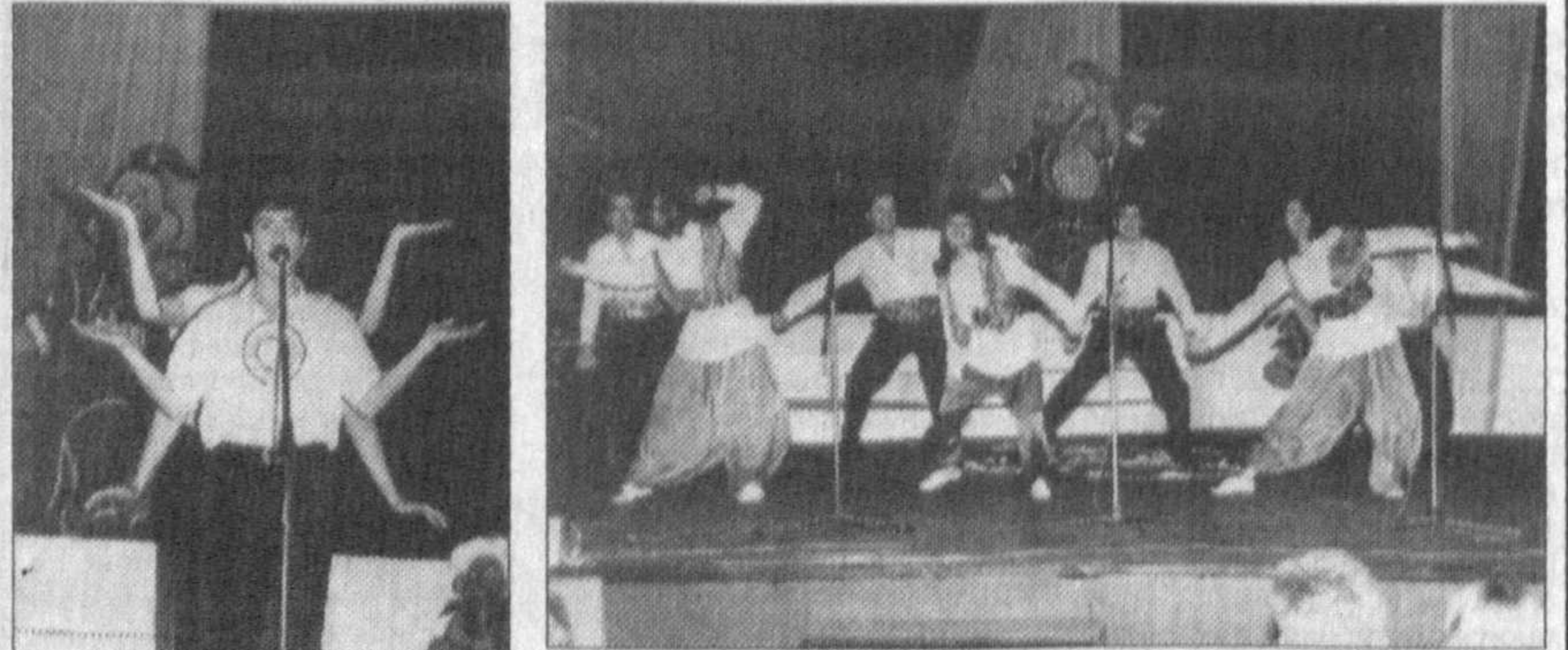
НА СНИМКАХ: кто лучший, решит жюри.