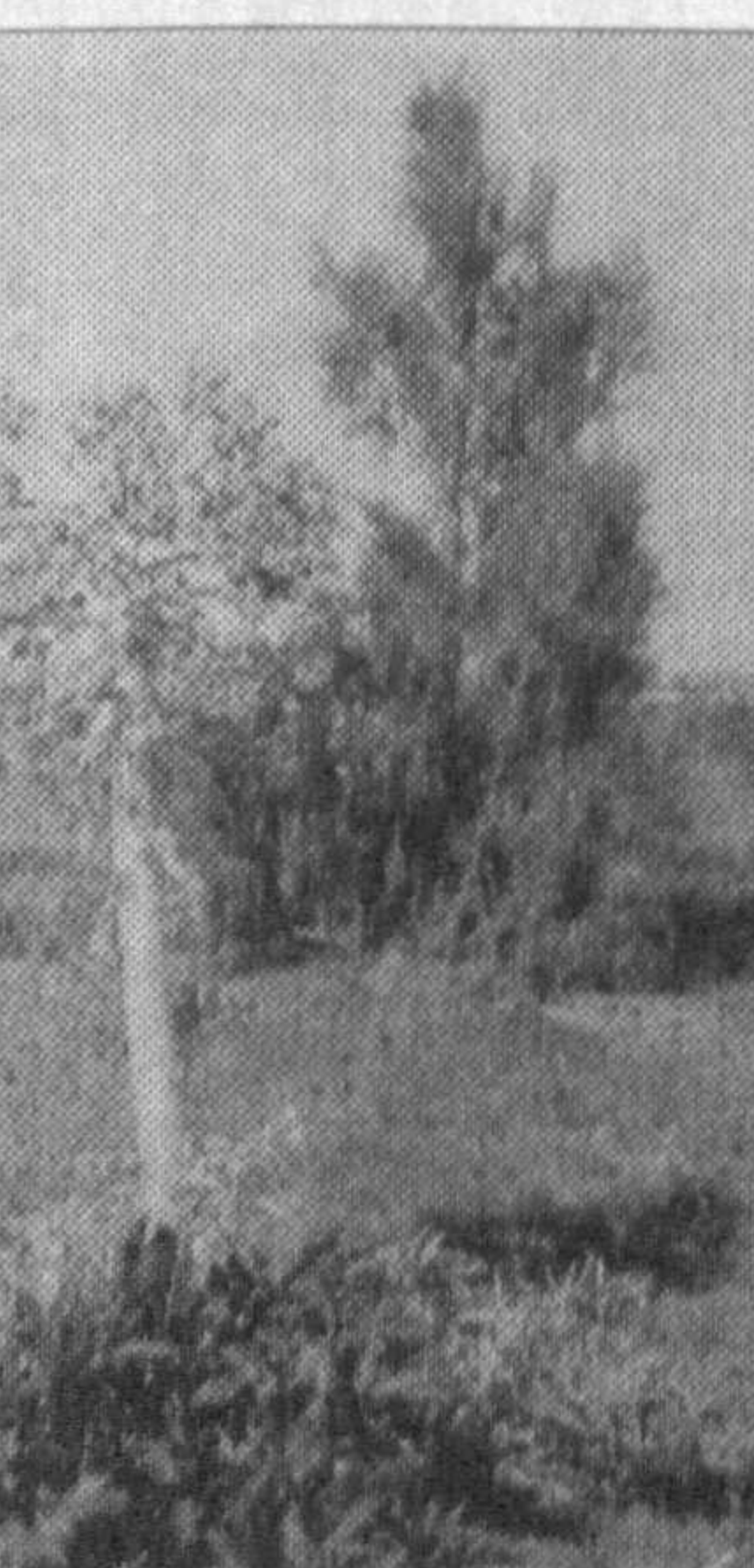
НА СНИМКЕ: майский «портрет» пустыни.

Неописуемо красива кызылкумская весна! Степь — словно бескрайняя ярмарка хивинских ковров. Природа была нынче щедра на дожди, и если хлопкоробам погода порядком омрачила настроение, то степные скотководы — на вершине счастья.