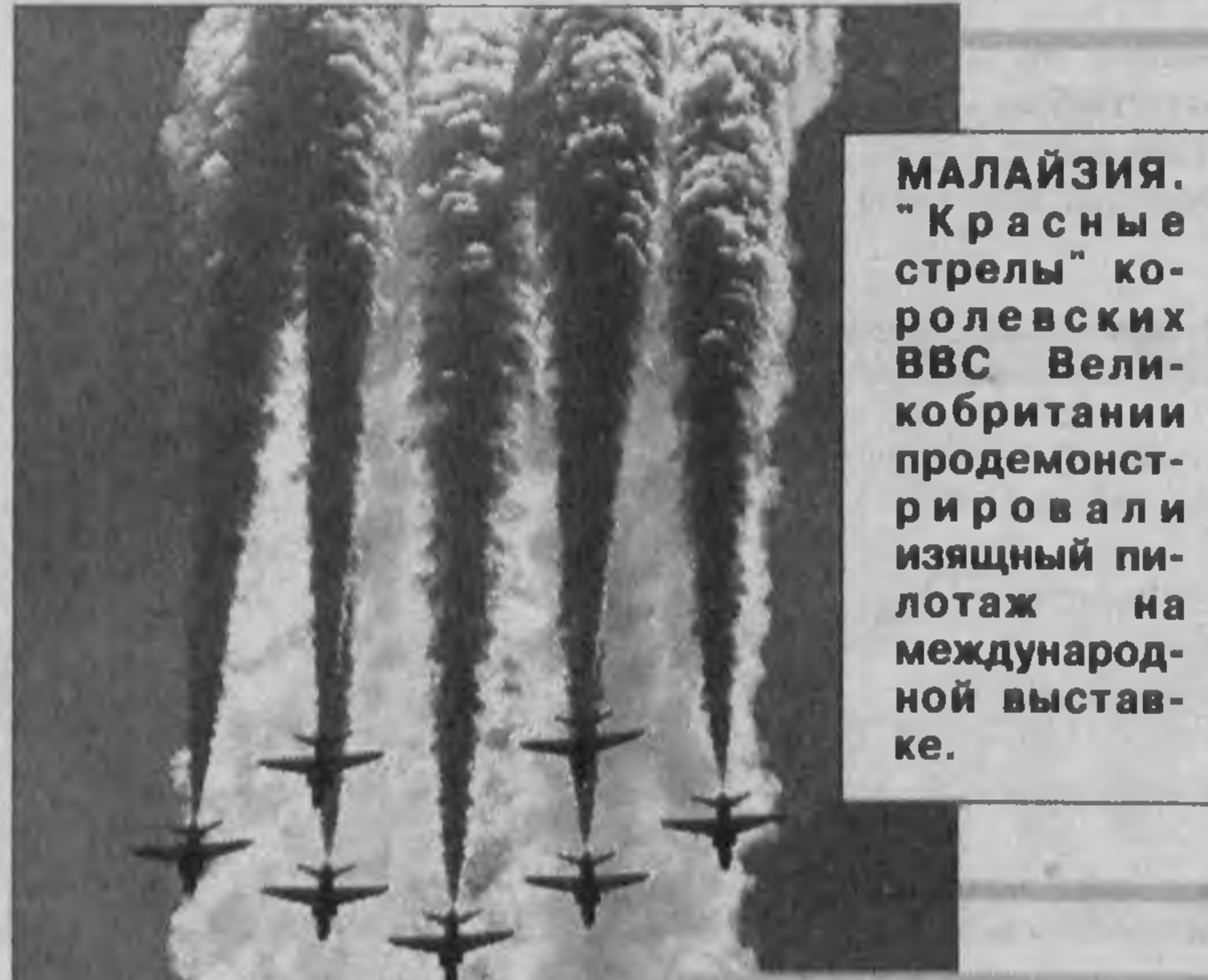
МАЛАЙЗИЯ. "Красные стрелы" королевских ВВС Великобритании продемонстрировали пилаж на международной выставке.

Переходное правительство Афганистана было бы радо привлечь иностранных инвесторов в страну. Местное телевидение переравало интервью специалиста по британским делам, который заявлял, что добыча газа поможет восстановлению экономики Афганистана. Если газ там будет найден и будет добываться, то в основном на экспорт. В самом Афганистане спрос недостаточен, но соседние Пакистан, Индия и Бангладеш, где экономика растет, с удовольствием утолят свой газовый голод.