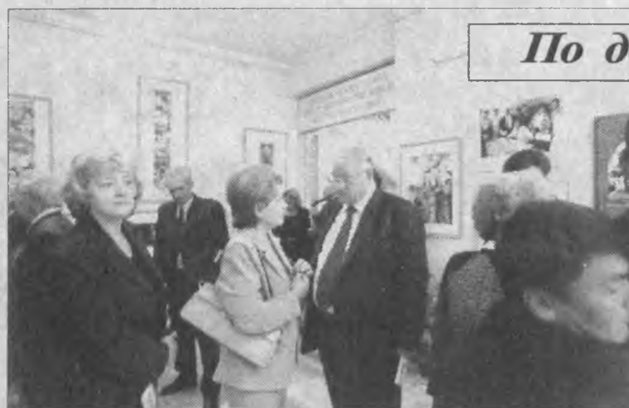
По долгу памяти