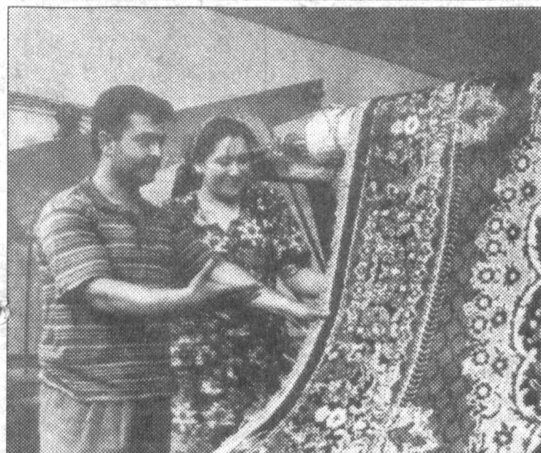
Организованное в Джизаке совместное узбекско-турецкое предприятие «Утжизахантеп»

Только действуя так, мы можем добиться, чтобы в нашем обществе верховенствовал закон, соблюдались права человека.