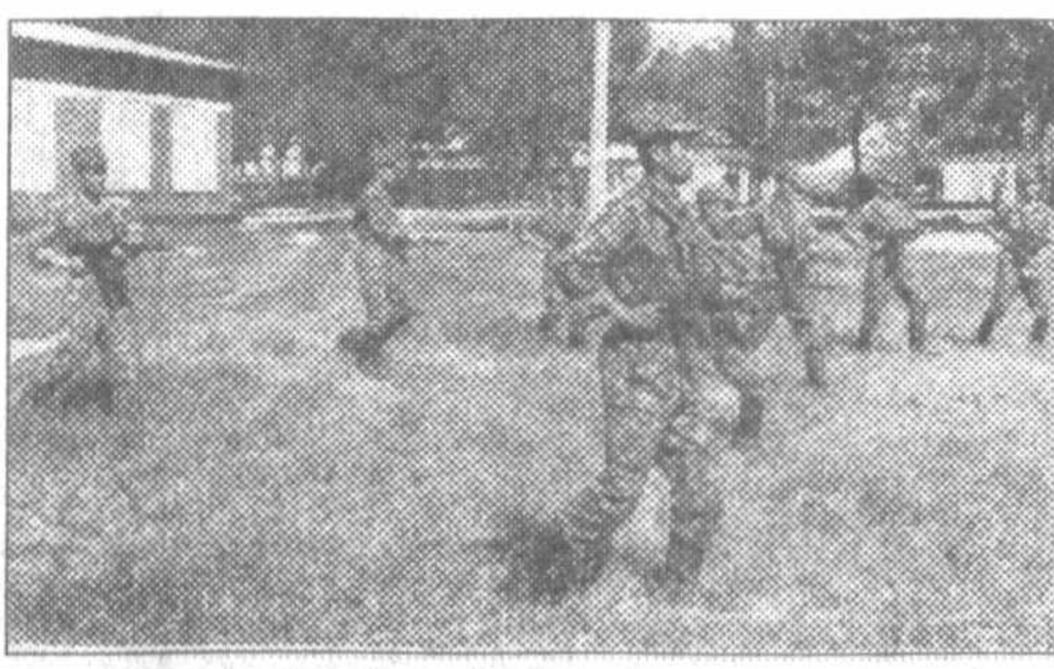
Курсанты военного училища в форме.