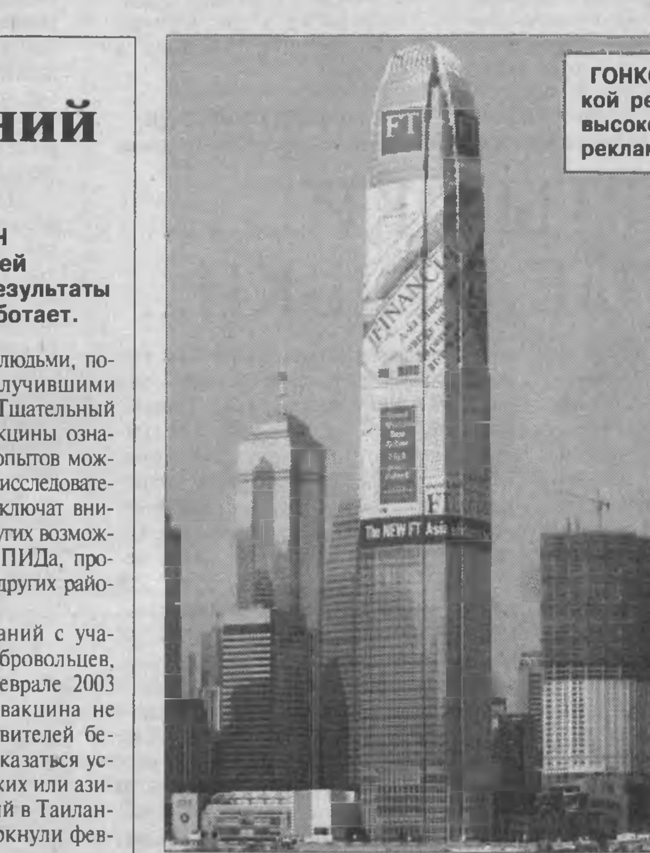
ГОНКОНГ. Очень большой городской рекламный носитель — самое высокое здание города обернуло в рекламу газеты Financial Times.

● В Японии из Дании прибыл Санта-Клаус в зеленой одежде, задачей которого является агитация за охрану окружающей среды и участие в акциях против потепления климата. До Рождества Санта-Клаус будет участвовать в различных мероприятиях и раздавать японцам семена растений. KYODO.