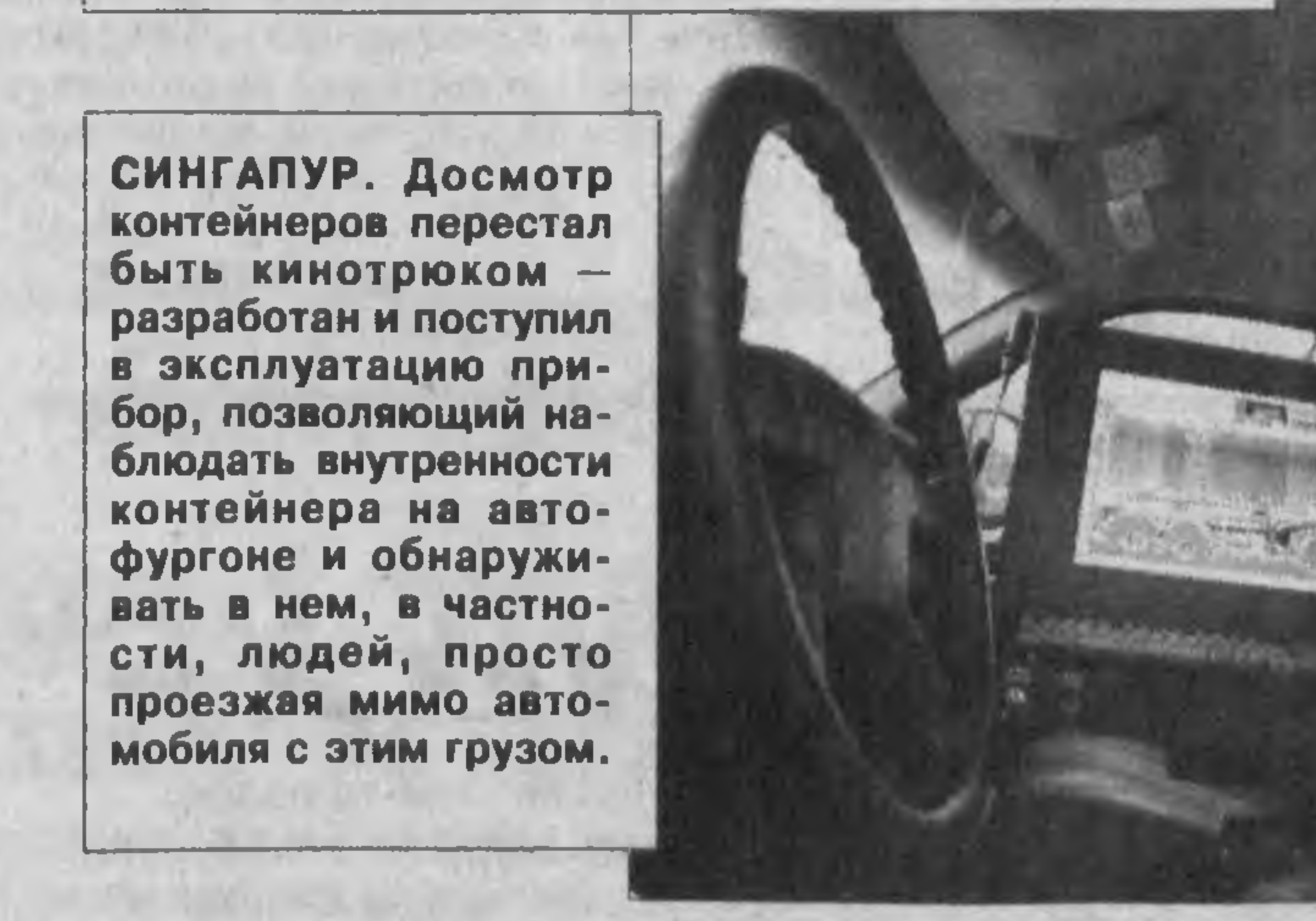
СИНГАПУР. Досмотр контейнеров перестал быть кинотрюком — разрабатан и поступил в эксплуатацию прибор, позволяющий наблюдать внутренности контейнера на автофургоне и обнаруживать в нем, в частности, людей, просто проезжая мимо автомобиля с этим грузом.