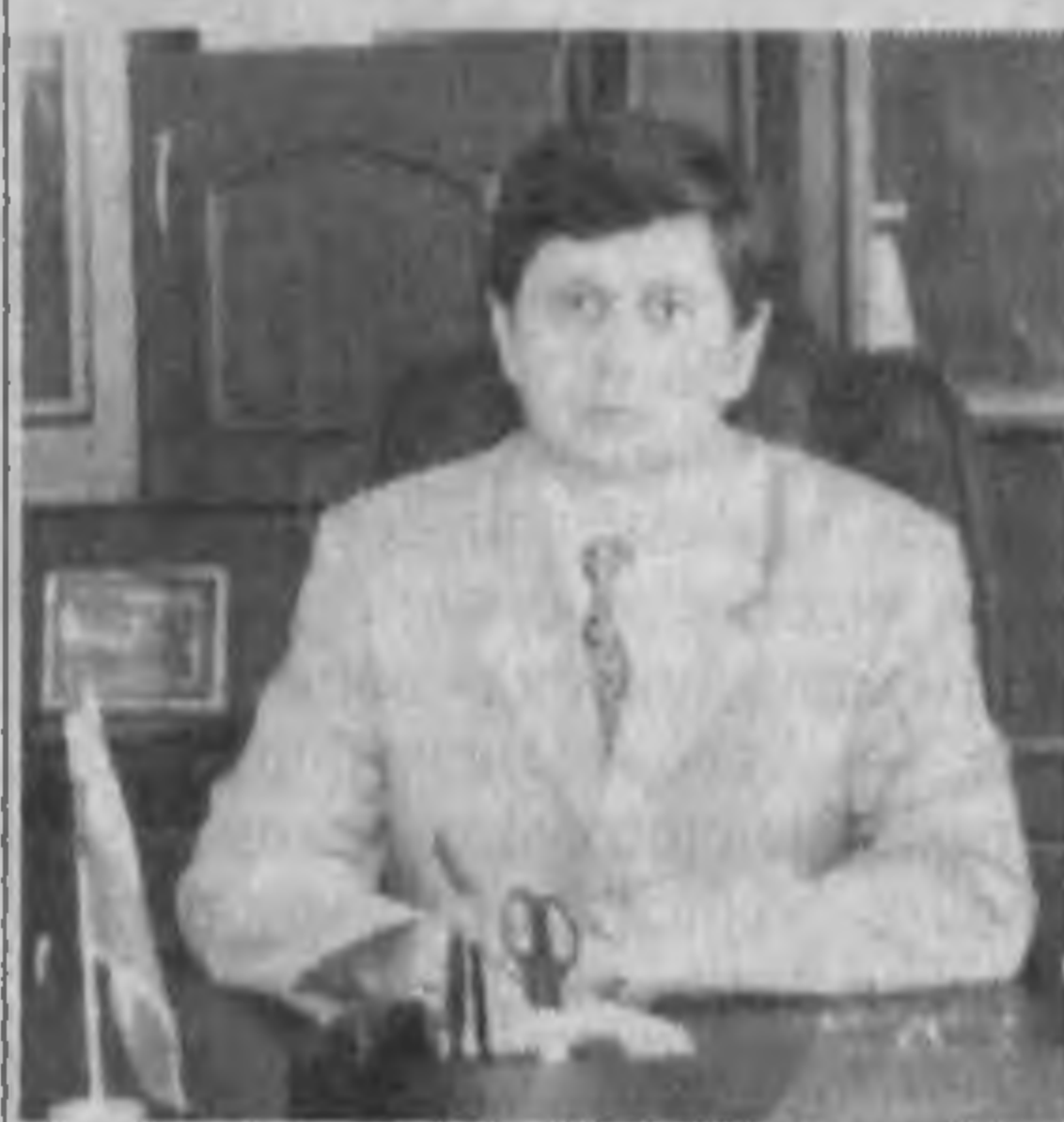
Пулат УРАБОВ, начальник Хорезмского областного управления народного образования.