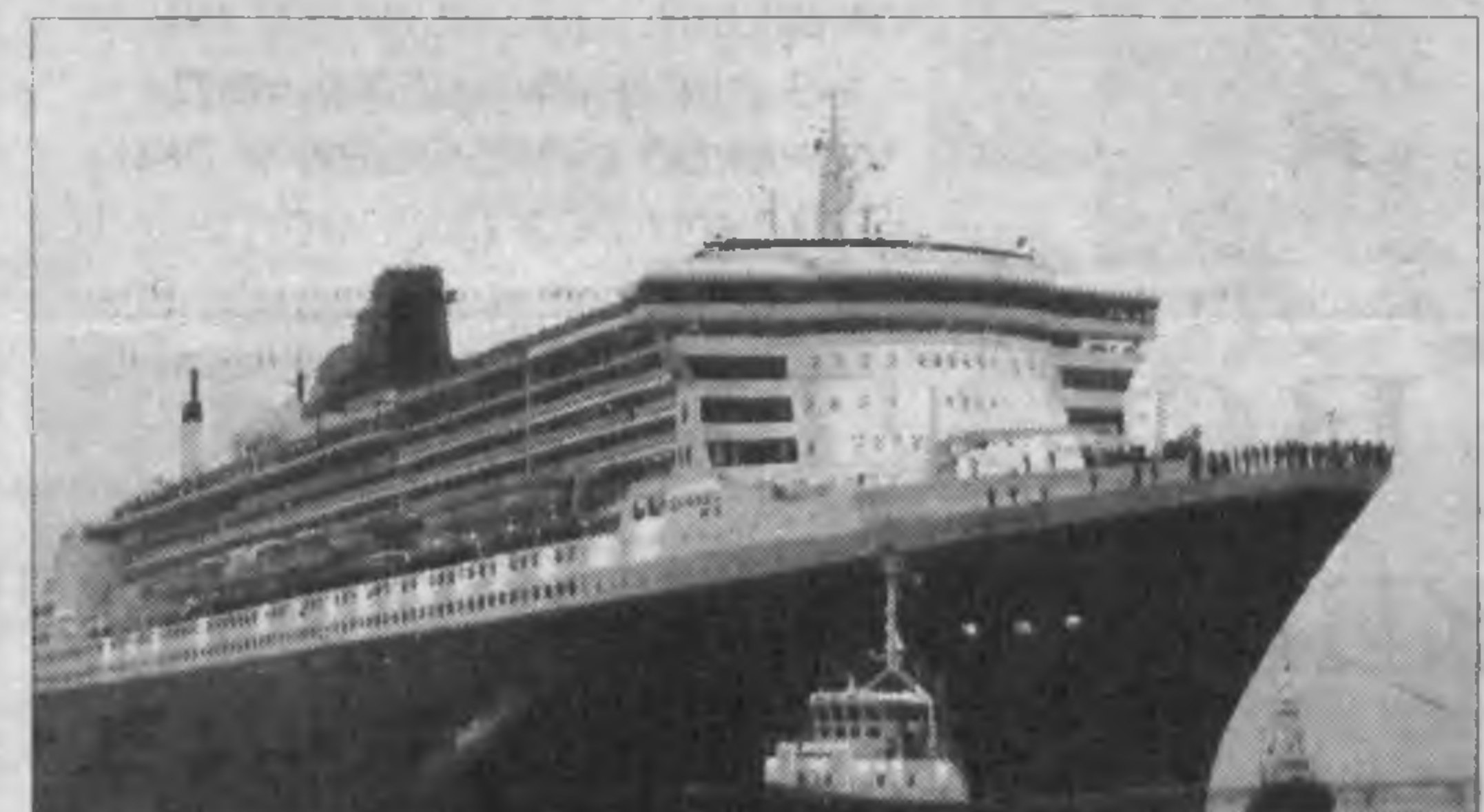
ФРАНЦИЯ. Queen Mary II — «Титаник» нового века — самый большой круизный лайнер, когда-либо спущенный на воду. Сейчас этот исполин длиной в четыре футбольных поля проходит последние ходовые испытания, а в свой первый трансатлантический рейс отправится в январе.

С октября будущего года те иностранцы, кому не нужна виза (в основном западные европейцы и канадцы), должны будут иметь паспорта, которые может читать машина. Лица, едущие в США не в качестве эмигрантов, будут сдавать отпечатки пальцев при получении визы. "Наши коммерческие, научные и академические институты всегда выигрывали от свободного обмена людьми, знанием и идеями", — говорит конгрессмен-демократ Генри Уоксман. — Нам надо себя защищать. Но нам не надо перегибать палку и лишаться преимуществ открытого общества".