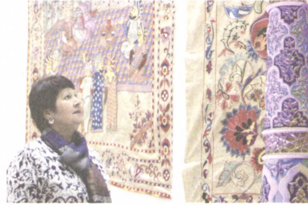
В Дирекции художественных выставок столицы состоялось торжественное открытие II Ташкентской международной биеннале прикладного искусства под названием "ЧЕЛОВЕК. СРЕДА. ИСКУССТВО".

седьмого поколения продолжают ремесло предков. В выставке принимаем участие с богатыми образцами гжуванского традиционного гончарного дела. Восстановили почти 200 древних орнаментов. Также вернули к жизни почти 80 исторических традиций гончарного дела. С образцами такого уникального вида искусства я посетил Японию, Германию, Францию, Соединенные Штаты Америки. Сегодня у меня много учеников, желающих познать все секреты этого ремесла.