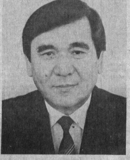
ЎЗБЕКISTON РЕСПУБЛИКАСИНИНГ БОШ ВАЗИРИ Абдулҳўшим МУТАЛОВ

Ўзбекистон Республикаси Олий Кенгашининг Раиси Ш. ЙўЛДОШЕВ. Тошкент шаҳри, 1992 йил 13 январь.