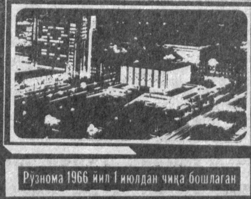
Рўзнома 1966 йил 1 июлдан чиқа бошлаган

№ 10 (7. 952) 1992 йил 16 январь, пайшанба Нархи 35 тиғини