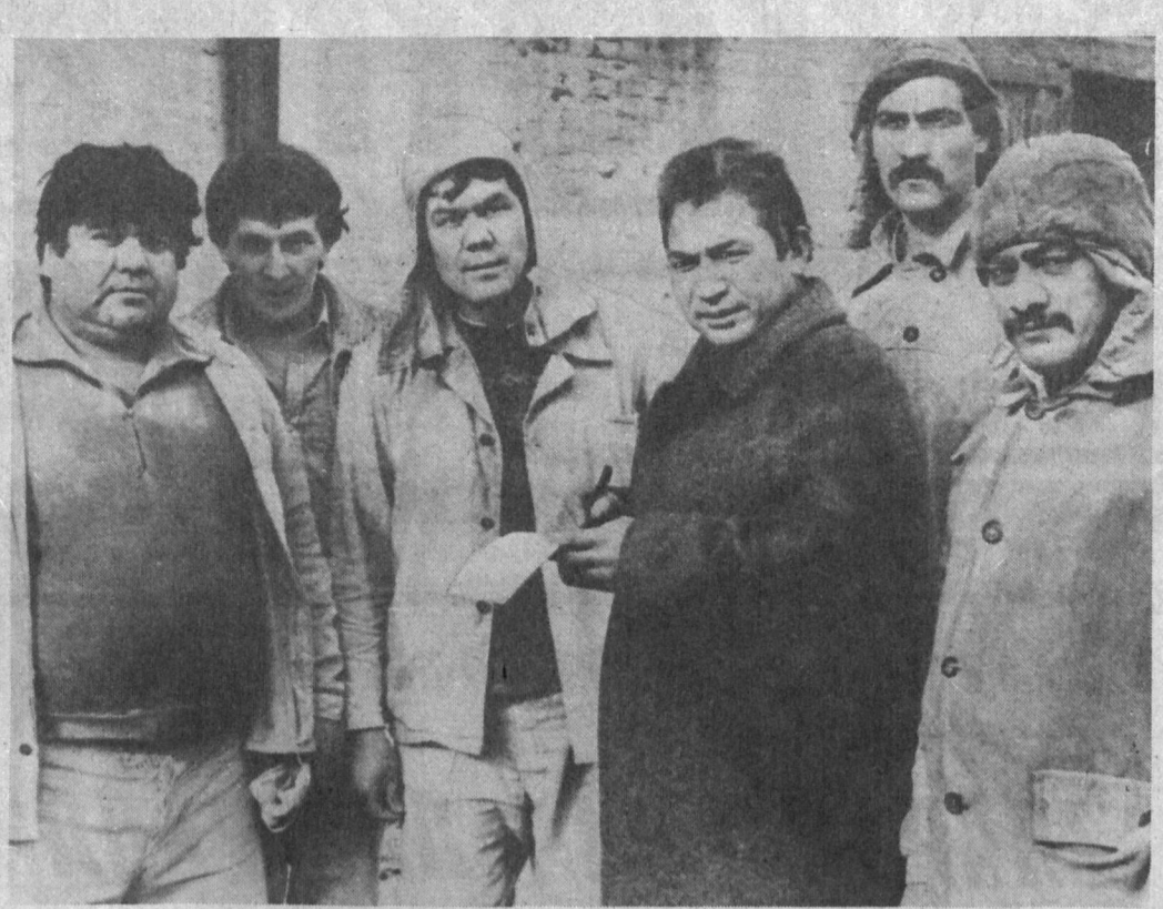
Шахримиздаги 3-ун заводи жамоаси томонидан тайёрланган маҳсулотлар ҳамшира сифатлиги билан ажралиб туради. Бу ерда жуда кўп ўз касбининг усталари бўлган кишилар меҳнат қилишляпти. Уларнинг машаққатли меҳнатлари билан дастурхонимиз бурсил.

Гулзода МАМБЕТОВА, «Тошкент оқшоми» мухбири.