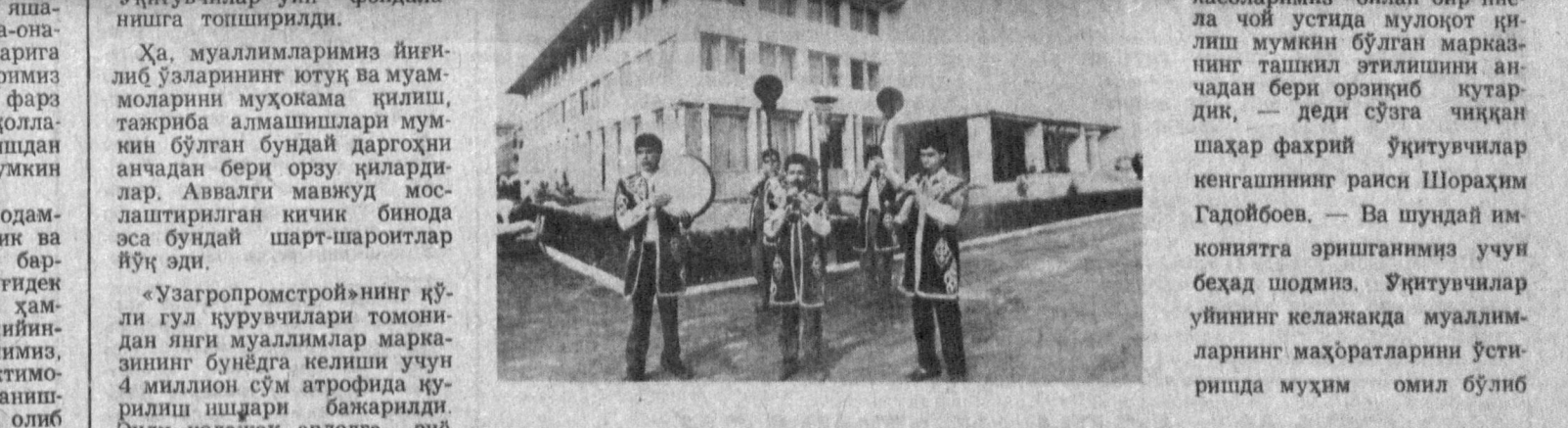
«Узгирпромстрой»нинг қўли гул қурувчилари томонидан янги муаллимлар марказининг бунёдга келиши учун 4 миллион сўм атрофида қурилиш ишлари бажарилди. Энди келажак авлодга энг тарқатувчилар учун ушбу уй, ўйлашмакки, маданият-маърифий тадбирлар уюштириши, илгор тажрибаларни алмашиш ва уни ҳаётга тадбиқ этиш учун марказ бўлиб қолади. Чунки аjoyиб мақсидлар зали, кутубхона, компьютер комплекси, ижодий суҳбат-музокаралар ўтказиш учун кичик зал, турли соҳалар бўйича клублар энди доимо ўқитувчилар хизматида.

Халқлар дўстлиги кўчасидаги республика киночилар уйининг ёнида кунга кеча ўқитувчилар уйи фойдаланишга топширилди.