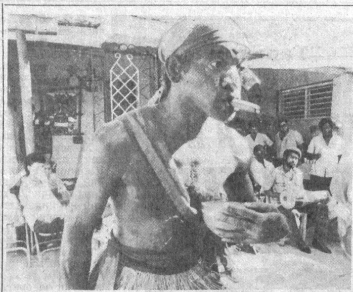
Кубада 1985 йилдан бўён мунча маркази ишлаб турибди. Унинг мақсади бошловчи создаларга ўз репертуарини бойитиш, иллий оҳангларга қўнма ҳосил қилишга қўмаклашиш ва уларни халқ маданияти билан таништириб беришдан иборат.