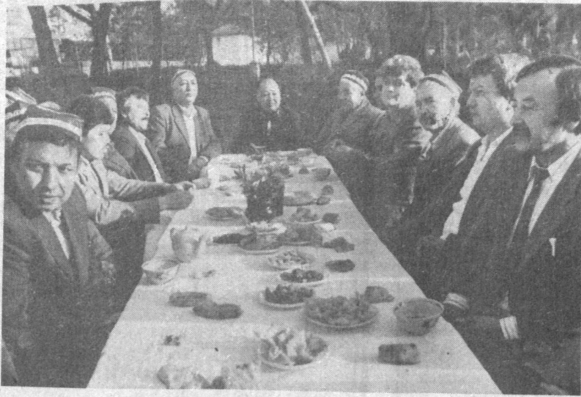
* Умрбоқий расм-русумларимиз