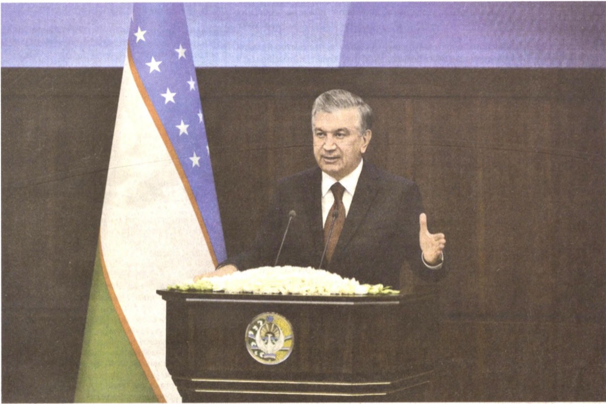
Президент Республики Узбекистан, Верховный Главнокомандующий Вооруженными Силами Шавкат Мирзиёев 10 января, в преддверии Дня защитников Родины, посетил Академию Вооруженных Сил.

В январе 2017 года глава государства поручил организовать на базе Ташкентского высшего общевойсковое командного училища абсолютно новое учебное заведение. Вскоре было принято соответствующее постановление Президента, и училище было