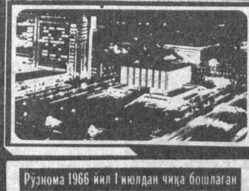
Рўзнома 1966 йил 1 июлдан чиқа бошлаган