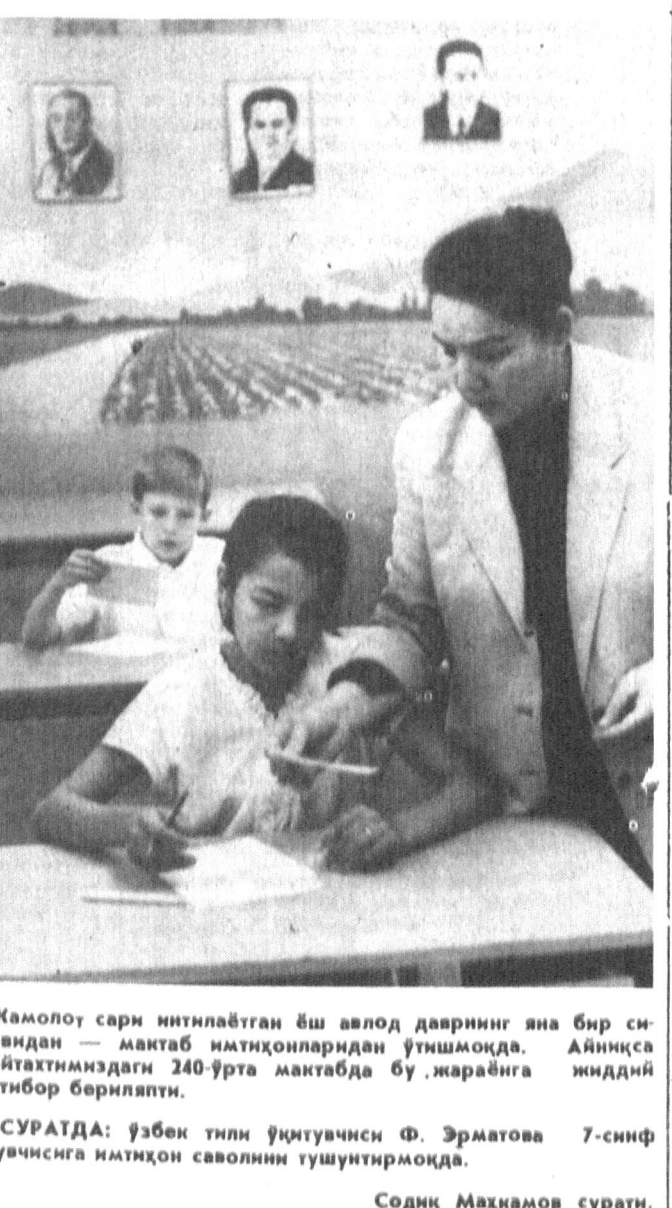
Камолот сарни иштирок этган ёш аёлларнинг яна бир сивовидан — мактаб илқинчиларидан ўтишмоқда