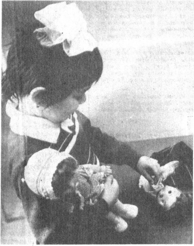
— Вой, қўғирчоғим сенга нима бўлди?