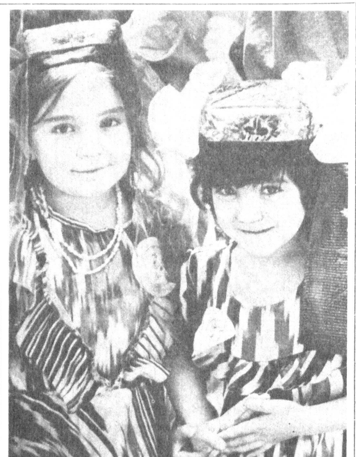
Мустақдл Ўзбекистоннинг гул-чечаклари.