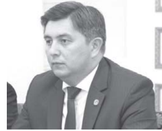
ассоциации «World Skills International».

В прошлом году по инициативе Министерства занятости и трудовых отношений в Яшнабадском районе столицы был сдан в эксплуатацию моноцентр «Ишга мархамат!» («Добро пожаловать на работу!»). В этом центре, обслуживающем незанятое население, недавно проводился первый открытый чемпионат Узбекистана по десяти рабочим профессиям. Самую высокую оценку заслужил этот турнир у делегации во главе с президентом международной