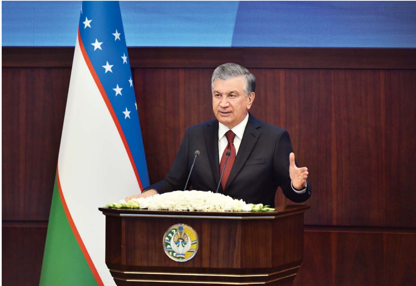
Президент Республики Узбекистан, Верховный Главнокомандующий Вооруженными Силами Шавкат Мирзиёев 10 января в преддверии Дня защитников Родины посетил Академию Вооруженных Сил.

В январе 2017 года глава государства поручил организовать на базе Ташкентского высшего общевойскового командного училища абсолютно новое учебное заведение. Вскоре было принято соответствующее постановление Президента, и училище было преобразовано в Академию Вооруженных Сил, вобравшую в себя самые передовые технологии и современные средства обучения. В январе 2018 года Верховный Главнокомандующий ознакомился с деятельностью новой академии.