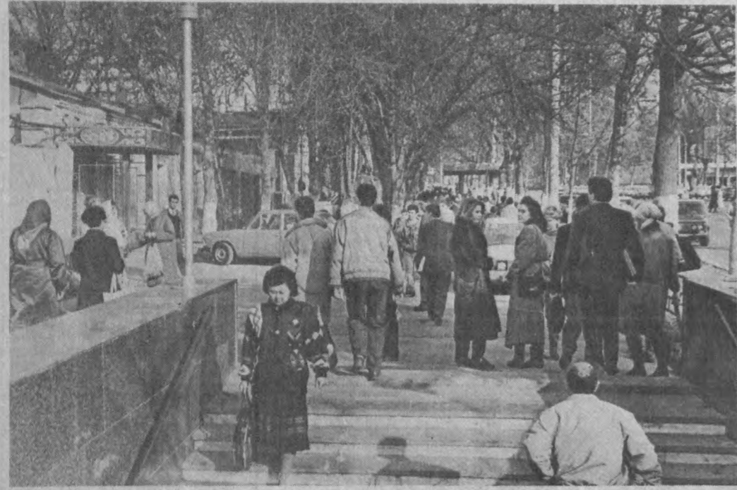
Поёнтхона кўчалари ҳаминча гавжум, файзли.