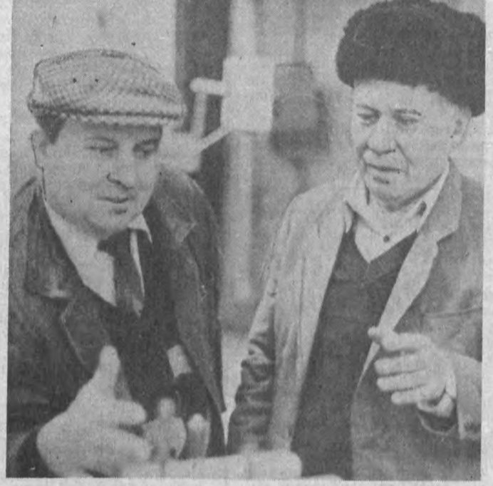
«Ўзбекистон» ишлаб чиқариш бирлашмасининг муҳандис-техник ходимлари корхонада ишини жадал бориш мақсадида бор маҳоратларини аямал меҳнат қилмоқдалар. Айниқса, бирлашма фахрийларининг бу борадаги фаолияти намуналандир.