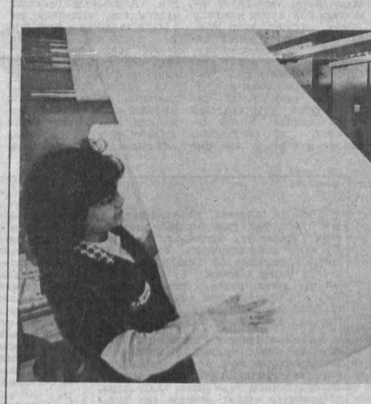
Тошкент тўқимачилик комбинатининг бўйаш фабрикасида чиқарган ҳар бир метр маҳсулот муваффақият томонидан диққат билан кўздан кечирилмади.

Унинг табарруқ қўллари бугун мустиқил Ўзбекистонимиз учун, унинг истиқбол учун қилиётган савй-ҳаракатларимизни ҳис этиб, оқ фотиҳа, дуога кўтаришган экан, бунинг учун чуқур миннатдорчилигини билдираман.