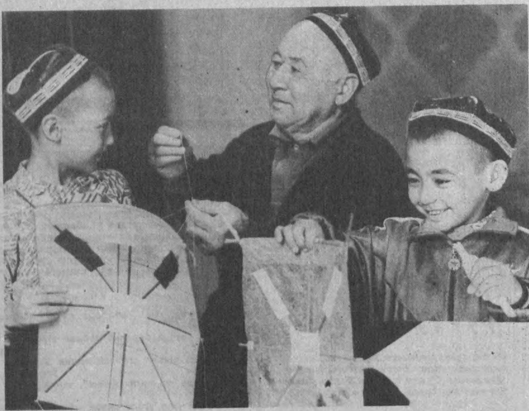
Уланимга баҳор келди. Бу фаслда айниқса маҳалларда яшайдиган болаларнинг қувончига қувонч қўшибди. Улар заррак учириб, олам-олам зами оладилар.