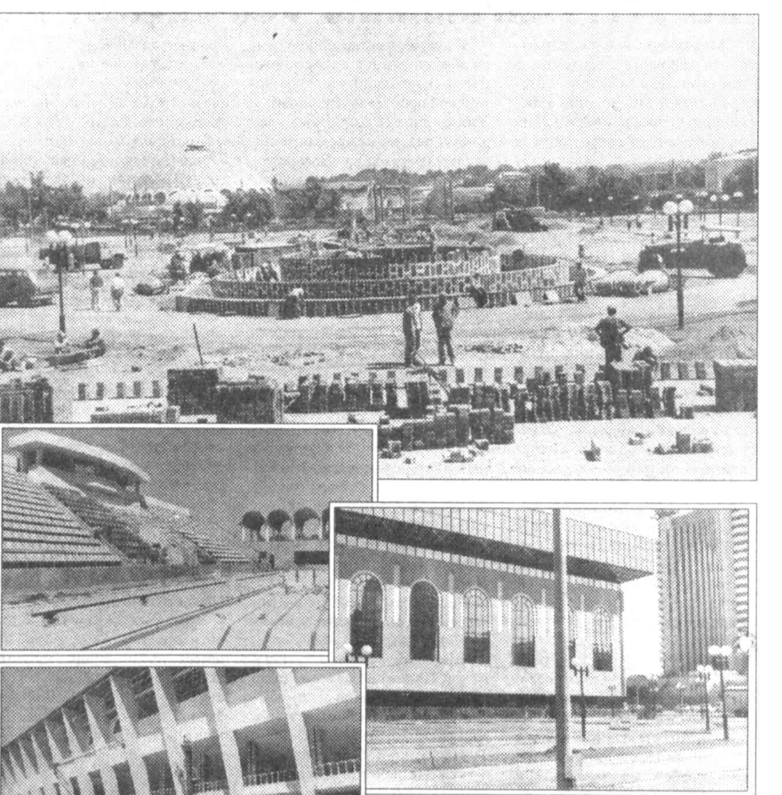
и один крытый стадион. Словом, здесь созданы самые прекрасные условия для спортсменов, и для болельщиков.

Спортивные арены станут местом проведения крупных международных соревнований. Здесь получат возможность повысить профессиональный уровень наши прославленные мастера, приобретут спортивные навыки будущие чемпионы. Возводятся спортивные сооружения — спортивно-оздоровительный комплекс «Чорус» торопятся подарить жителям нашей страны строители. Уникальное по замыслу и исполнению спортивное сооружение отвечает самому высокому уровню мирового стандарта. В состав комплекса входят тренировочные зилы, плавательный бассейн с трибунами для зрителей, пять открытых теннисных кортов