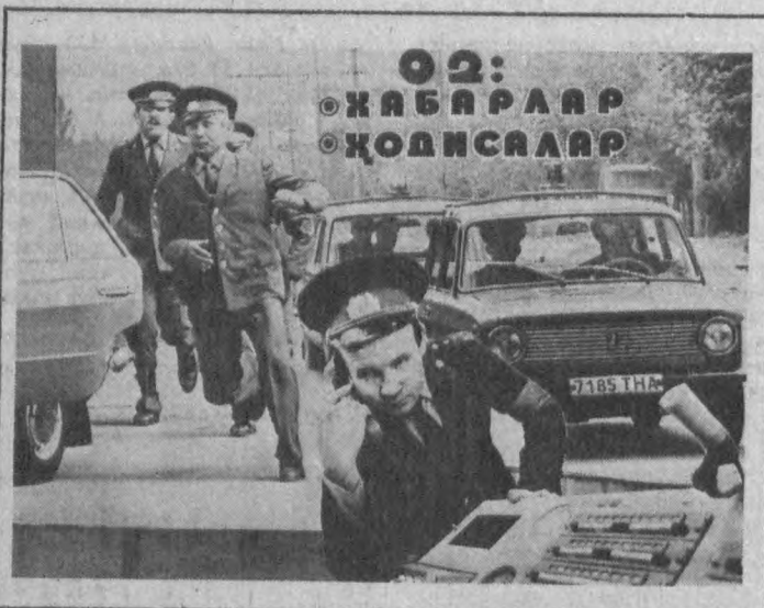
02: ЖАББОРЛАР ҚОДИСЛАР