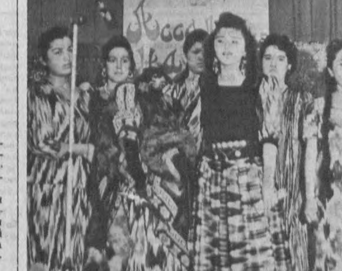
СУРАТДА: бир гуруҳ юқори снф ўқувчилари миллий удуммиз бўлган «Келин саломи»ни ижро эттишмоқда.