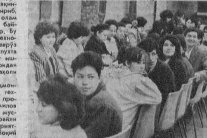
СУРАТДА: институтда ўтказилган Наврўз аёми тантаналаридан лавҳа.