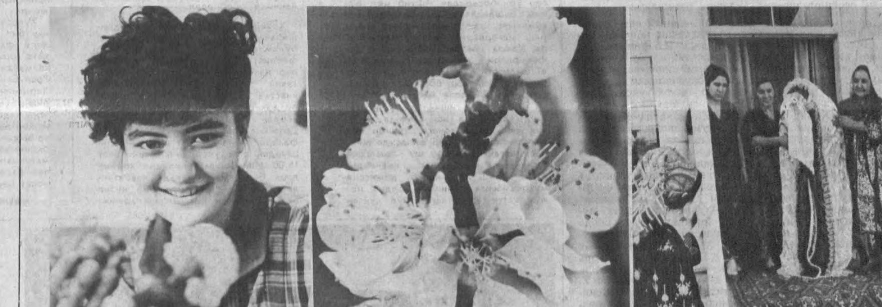
Гўзалларга жозиб, гўлларга чирой, келинларга латофат улашиб, юртимизда Наврўз кезмоқда.