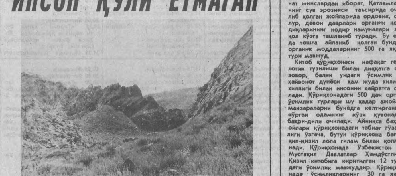
МУСТАҚИЛ Давлатлар Ҳамдўстлигида ягона бўлган Китоб давлат қўриқхонаси эри кураеси жўроғи тарихининг табиий-илмий ёдгорлиги бўлиши палеонтология-стратиграфия нуқталарини ўрганиш ва табиатнинг яна бир ноҳий бурчагини асраш мақсадида қўйилган. Китоб қўриқхонаси Зарафшон тоғ тизмасининг жануби-ғарбида Жиннидарнинг кап тарафидан, Китоб шехридан 45 километр шарқда жойлашган. Бундай ўзига хос қўриқхонанинг айнан шу ерда ташкил қилиниши бежиз эмас албатта, унинг ўз тарихи бор.

1978 йили Самарқанд шехрида геологларнинг катта халқаро анжумени бўлиб ўтди. Девон деври стратиграфиясини ўрганишга бағишланган ушбу анжумани ўн уч хорижий давлатнинг етакчи геолог олимлари ташриф буюрдилар. Буларнинг қўриқхона ҳудудида ташкил қилинган илмий кузатишлардан олимлар ўз ердаги манзаралардан ҳайратда қолдилар. Негизи Хўжақўрган ва Зинзилбон, Новабак каби бир қатор сойларнинг кўп йиллар давомида ўз ўзинини чуқур ўйиши натижасида ҳозирда бу ерда яхши сақланиб қолган эди. Табиатнинг инчонини қарангки, бошқа ўлкаларда жуда тарқок жойлашган турли дарағаларга хос қатламлар бу ўлкада, табиатнинг кичик бир бурчагида арқин ва кенг муқамаллашган экан.