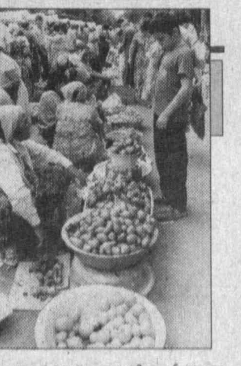
товара в среднем на 3 — 5 тысяч сумов. Кстати, именно на таких столиках мы порой приобретаем и сомнительного свойства спиртные напитки.

Но это — рынок. Есть, однако, еще и уличная торговля, которая, лишь на первый взгляд, имеет малый денежный оборот. Проходи по тротуару мимо столика, где продается сигареты, жвачки, шампиньоны, конфеты или печенье в иркой упаковке, а любовь из нас нет-нет да и подумает — такая форма услуг очень удобна. Но мало кто задумывается, что молодой человек, стоящий за столиком, работает только на себя и на «дядю», чей товар он реализует. Платить налоги? Зачем? Так ведь лучше. Каждый такой «столик», между тем, реализует