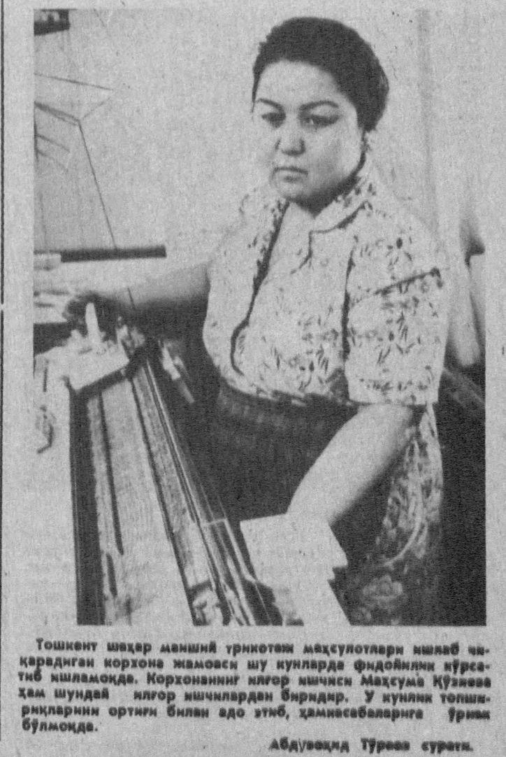
Тошкент шаҳар маиший урнотини махсулотлари ишлаб чиқарадиган қорхона жамоаси шу кунларда фидойилик кўрсатаётган ишчилардан бири. У кунини топшириқларини ортин билан адо этиб, ҳаммасебаларига ўрин бўлмоқда.