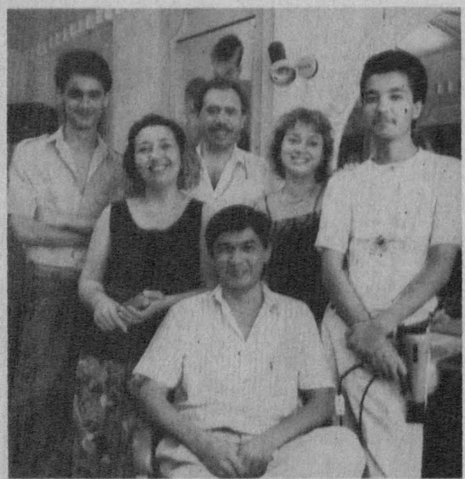
«Экспериментал» институтига қаршли «Мунтазир» ички қорхонасининг фойдали кирсатётганига ҳали кўп вақт бўлган йў. Лекин шунга қарамай жамоа халқимизга хизмат кирсатиш борасида ўз меҳнатларини аяматирлар. Улар саргардонликдан тортиб гўзаллигини барча сир-асрорлари бўйича шаҳримизнинг маркази ва унинг турли бурчакларига транспортлар қатнови йўлга қўйилган. Улар мунтазам ҳаракатда бўлиб, йўловчиларнинг узогини яқин қилиб туртирди. Шундай катта бекат бир нечада бўлиб ташланди. Унинг атрофидаги дўконлар, саргардонхона кўчирилди, улар ўрнида тепалик пайдо бўлди.

— Ироқидан аввалига бекат қайта тикланиб, фойдаланишга топширилса керак, деган умидда бу ердаги бунёдкорлик ишлари тезда тугалланб, транспортлар яна аҳоли хизматиға тахт туришига ишонч ҳосил қилинди. Аммо орадан кунлар ўтса ҳам қурилишда сийлиқ бўлмади. Ҳозир бу ерга келганлар ҳақиқи аҳолини қўриб, ҳайратга тушилади. Ҳаммасида ҳам йўловчиларнинг сарсон-саргардон бўлаётганини айтмайсизми? Улар авто-