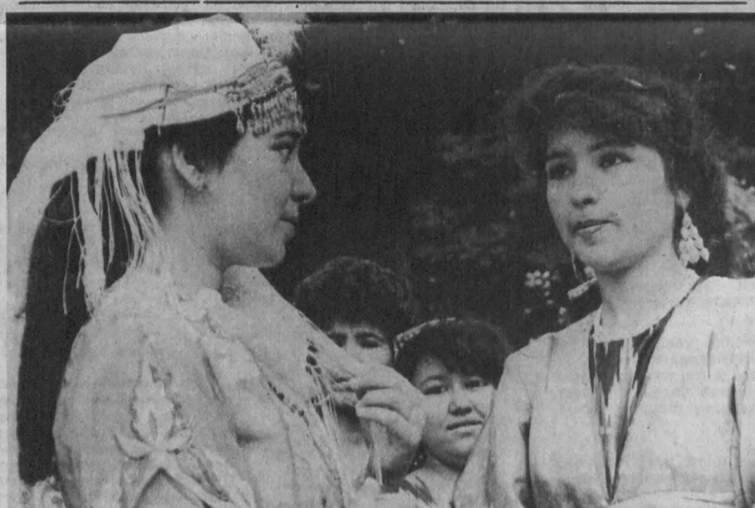
Ҳозирги кунда ҳаваскор санъаткорларнинг ҳар бири чиркинчи томошабинлар олқиши билан кутиб олинапти.