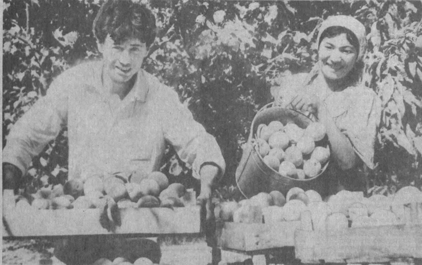
Томирқаданги мевали дарахтларга ўз вақтида ишлов бериб парварниланса ана шундай мўл-қўл ҳосил етиштириш мумкин.

вафот этганлиги муносабати билан чуқур таъзия изкор қилади.