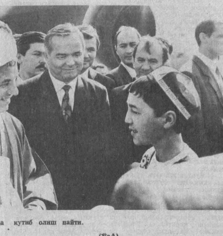
СУРАТДА: Аэропортда кутиб олиш пайти.

да мамлакатларимиз ўртасидаги ҳамкорлик йўналишларини белгилаб оламиз. Ислам Каримов юксак мартабали меҳмонни, Ўзбекистон халқи номидан сэмимий қутлади. Бу таширф икки мамлакат ўртасидаги муносабатларда янги саҳифа очади, деб умид билдирди. — Биз ўтган йил ноябрда Эронга борганимизда Акбар Ҳошимий Рафсанжоний жанобларини мамлакатимизга тақдир этган эдик, — деди Ўзбекистон Президентини. — Бу тақдиримиз амалга ошганидан мамнунмиз. Эрон ва Турон халқларининг маълум сабабларга қўра узилиб қолган дўстона алоқаларини тиклаб, келажак авлодларга етказиш биз учун ҳам қарз, ҳам фарз. Музокаралар чоғида муҳомама қилинадиган мазмулар кўп, лекин энг муҳими иқтисодий ҳамкорлик масалаларидир. Шундан сўнг автомобиллар қарвони меҳмонларга ажратилган қароргоҳ томон йўл олди.