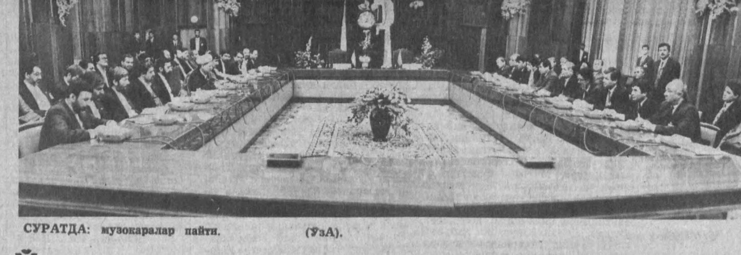
СУРАТДА: музокаралар пайти.

Хужжатларини имзолаш маросимидан сўнг Эрон Ислам Жумҳурияти Президентини Акбар Ҳошимий Рафсанжоний ва Ўзбекистон Республикаси Президентини Ислам Каримов Халқлар дўстлиги саройида журналистлар билан учрашдилар. Ўзбекистон Президентини йўл қурилиши, икки пойтахт ўртасида самолёт қатновини очиб, транспорт, нефть, газ, қишлоқ хўжалиги, банк алоқалари ва савдо-иқтисодий ҳамкорлик юзасидан ўтказилган музокаралар, имзоланган ҳужжатлар хусусида гапирди. 1992 йил ноябрь ойида Ўзбекистон раҳбариятининг Эронга расмий таширфи чоғида имзоланган ҳужжатлар бу сафарни қадриятли раҳбарларимизнинг ҳамкорлик қилиши билан тўғрисидаги фикрларини, муаммоларини ҳал этишининг маълум беш муҳим жиғатини айтиб ўтди. Бу муаммони ҳарбий куч ишлатмасдан, музокаралар йўли билан ечиш лозимлигини, уни фақат Тожикистон халқи ва ҳукумати ҳал этиши зарурлигини таъкитлади.