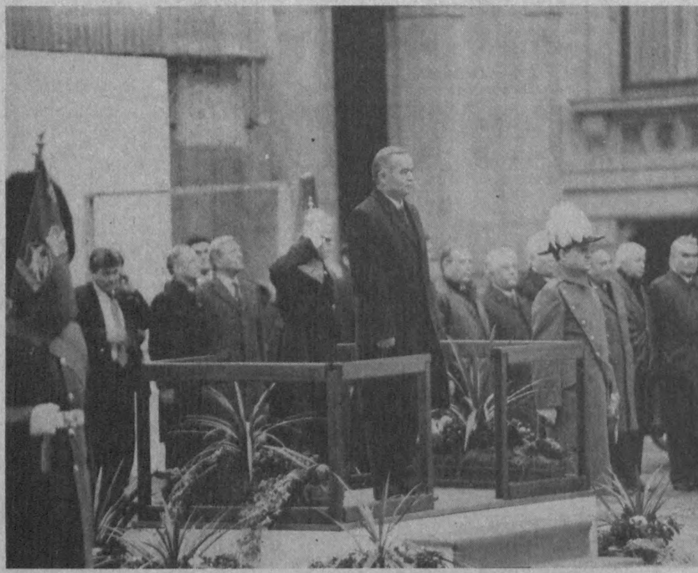
Ўзбекистон Республикаси Президенти Ислам Каримов Буюк Британия Бош вазирини қароргоҳида.

тезроқ қўшилишига имкон яратди. Банкинг биринчи Президенти этиб Франциянинг кўзга кўринган жамоат арбоби Жак Аттали сайланган эди. 1993 йилнинг августидан унинг ўрнини илгарчи Халқаро валюта фонди бош директори, сўнгра Франция банки президенти лавозимларида ишлаган халқаро молиявий ишлагадани Жан де Ларозьер эгаллади. Ўзбекистон мазкур банкка 1992 йил бошда СССРга тегишли бўлган акциялар республикаларга тақсимланганидан сўнг аъзо бўлди. 1992 йилда Европа Қайта тиклаш ва тараққиёт банки Ўзбекистонга нисбатан стратегия қабул қилди. У банкнинг банк ва ишбилармонлик тузилмаларимизга маслаҳат бериш борасида анча-мунча ишларни амалга оширди. Ана шу Европа Қайта тиклаш ва тараққиёт банкнинг ҳашаматли залида Президент Ислам Каримов Жак де Ларозьер, бош котиб Барг де Бланк билан учрашди. Ўзганин ва самимий ўтган учрашув аниқ-тиниқ дастур-ҳужжатларни имзолаш билан якулилади.