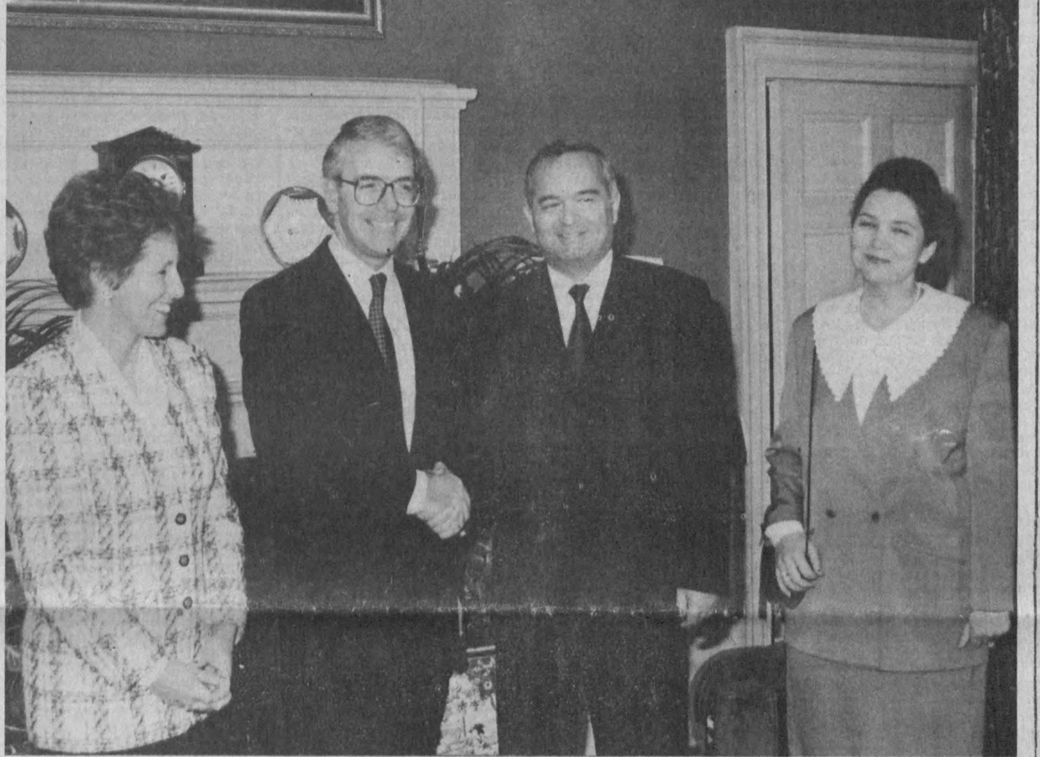
СУРАТДА: Ўзбекистон Республикаси Президенти Ислам Каримов ва Буюк Британия Бош вазири Жон Алвар ИЛЕСОВ олган сурат.

Албатта, инглизлар ва ай-ниқса, унинг ишбилармон ва-