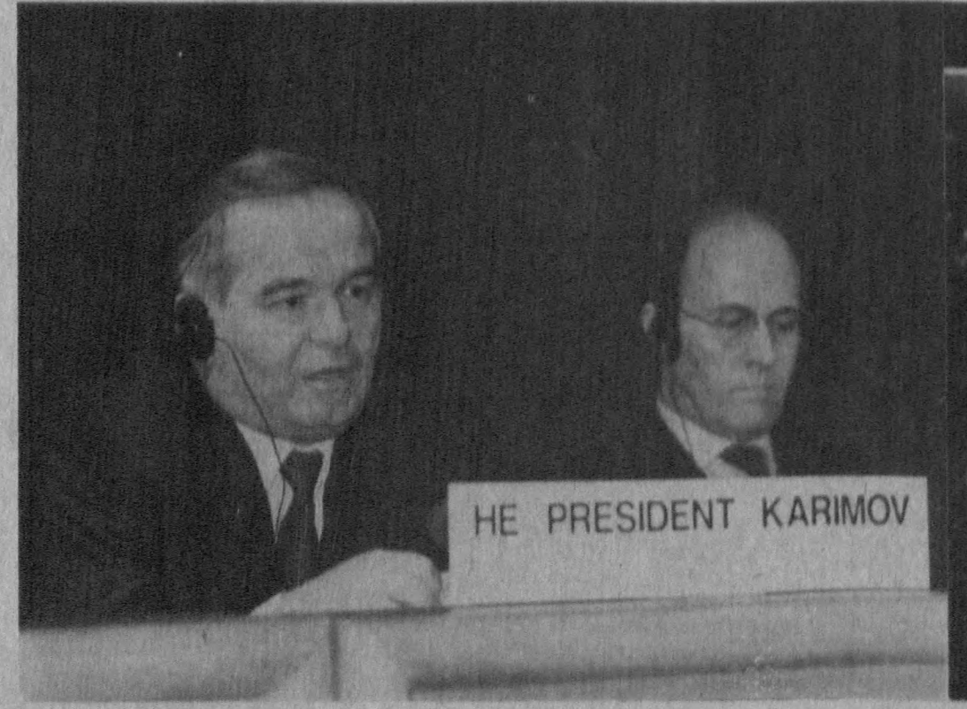
Ислам Каримов Буюк Британия Саноат конфедерациясига Англия ишбилармонлар доираси вакиллари билан учрашув пайтида.

24 ноябрь кунги, айниқса қизғин ва янада самарали воқеаларга бой бўлди. Президент Каримов «Побджой» нул ишлаб чиқариш компаниясини бориб кўрди. Унинг раҳбарлари билан суҳбатлашди. Шундан сўнг «Лонро» компаниясига ишлаб чиқаришни кўздан кечирди,