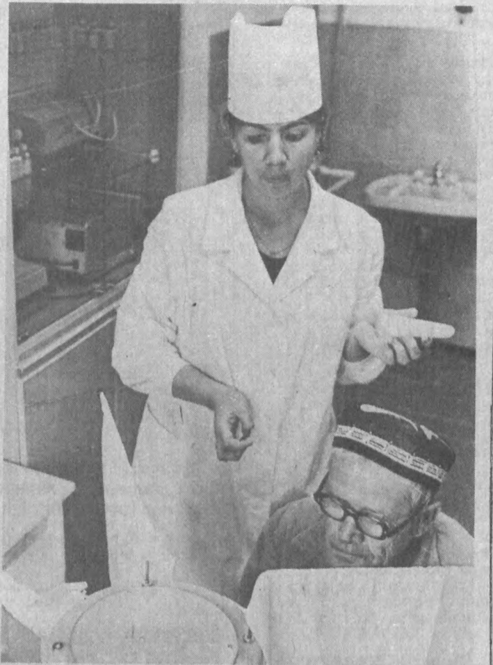
Яқинлари билан учрашишлари ёни шифокорнинг маърузаларини тинглашлари мумкин.

Хар қандай янгиликнинг аввалигиларга ўқшамаган ўзинга ҳос томони бўлади. 18-касалхонада ҳам шундай. Бу ерда беморлар учун алоҳида катта хона ажратилган. Мазкур хонада улар ўзаро гурунлашиб дам олишлари, ҳол-аҳвол сўраб келган