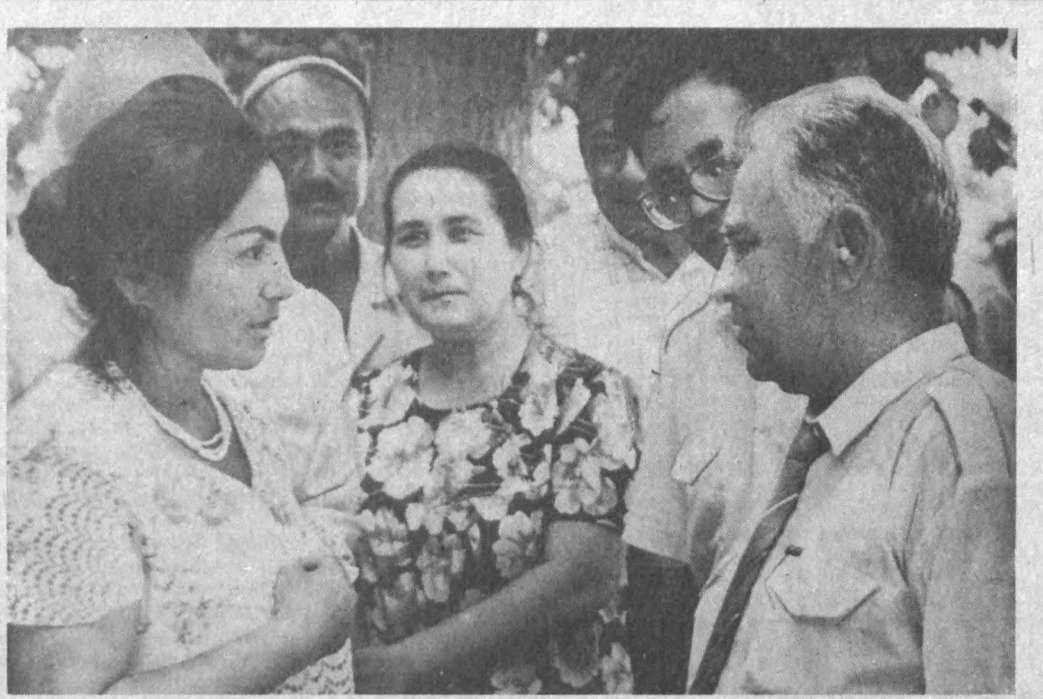
Ҳар бир адиб ўз китобхоналари билан учрашганда янги-янги илҳом булоғи кўзларини очгандек бўлади. Чунки бундай учрашувлар ёзувчига тўғривақ қаҳрамонларни, ёзилмак мавзуларини кашф этишга имкон яратди. Қизгин суҳбатларда у яратган асарлар ўзининг ҳақиқий баҳосини топади.

Эсар майин шабдода, Райқон иси уфурар. Ерим хабар олмасан, Омонатинг тошларим. Кузги бог сўзим-сўзим, Ҳижронда ёнди дилим. Қўларим нигорондир, Келмади суйган гулм. Ушун-ушун арамчи, Ушун-ушун арамчи. Ушун кун ўтди ҳар кунимнинг, Қўларимиз элдиларим. Ушун кун ўтди ҳар кунимнинг, Қўларимиз элдиларим. Ушун кун ўтди ҳар кунимнинг, Қўларимиз элдиларим.