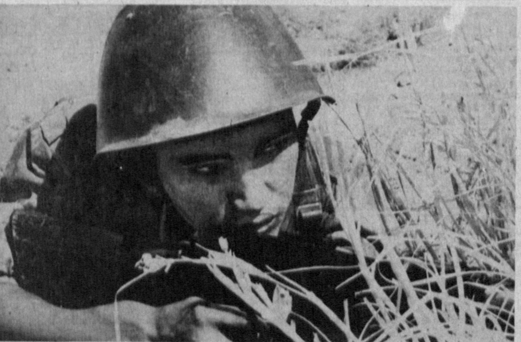
Мустақил диёримиз сархалларининг еш посбони.

Табиат кўйиндаги борлик мавжудот ва наботот дунеси бу унсурдан куч-қувват олиб яшаб келган. У инсонга мўмине қатори шифобахш хусусиятлари билан беназир хизмат қилиб келмоқда. Буюк ҳаким Абу Али ибн Сино ва бошқа машҳур табиблар ўз муолажаларида ундан кенг фойдаланишган.