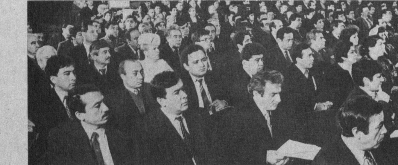
• СУРАТДА: пойтахт тадбиркорлари кенгашида.

Шаҳар тадбиркорлари кенгаши материалларини “Тошкент оқшоми” муҳбирлари Дилшод ИСРОИЛОВ ва Гулом ЮСУПОВлар тайёрлашди.