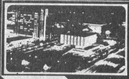
Газета 1966 йил 1 июлдан чиқа бошлаган