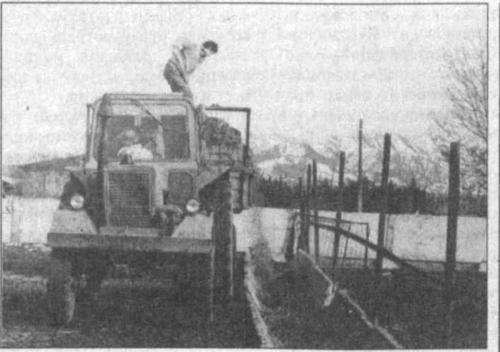
НА СНИМКАХ: приготавливаются корма для животных; доярка Муниса Эргашева.

Все это поголовье содержится в тепле и сытости благодаря таким работникам, как доярка Муниса Эргашева. За ней закреплено 25 дойных коров, от каждой из которых за год она получила более 2 тысяч литров молока.