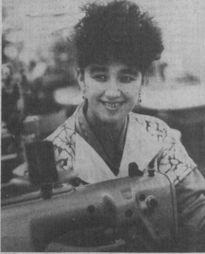
«Юдуз» тивувчилик ишлаб чиқариш бирлашмаси тивув цехларида тайёрланган костюм-шмаллар, болалар кийимлари, эриқ ва аёлларнинг усти либослари сифатлиги билан...

АВРОР Ҳидоятлов номли Ўзбек давлат драма театрида бизга яхши таниш бўлган америкалик рақоса Грей хоним билан хайрлашув концерти бўлиб ўтди.