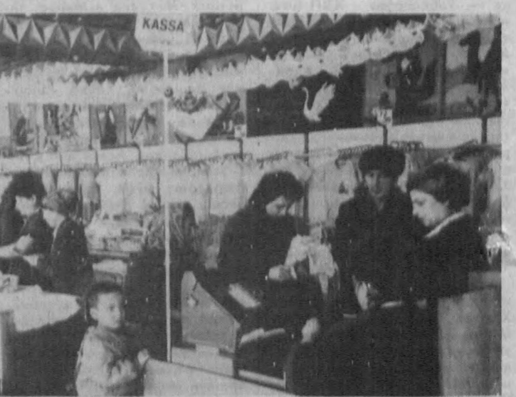
Сўхбатни Маҳмуд ОРИПОВ энг оқди. СУРАТЛАРДА: «Болалар дўноси» дўконинда янги йил савдоси.