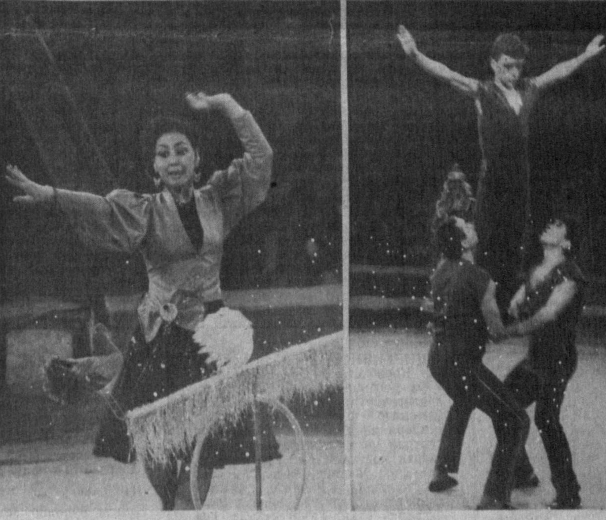
Тошкент давлат циркида болалар учун сахналаштирилган янги йил байрам томошасида иштирок қилган болаларнинг янги йил байрамидан кўнглини қолдирган рақс кўрсатишлари.

КИОСК деганда биз олад-да турли газета, журнал ва шу билан ҳар хил навлардан солинган дўконни англаймиз. Рус тилида бу сўзга «павильон» (турли иш-ларга маъқул қўрилган, махсус жиҳозланган бино) деб изоҳ берилади. Шунинг-де, у майда савдо дўкон-часи маъносинда тушунтирилади. Бу туркий сўз асосида «киоскер» сўзи ҳосил қилинган. Ўзбек тилида у, киоска шаклида қўлланилади.