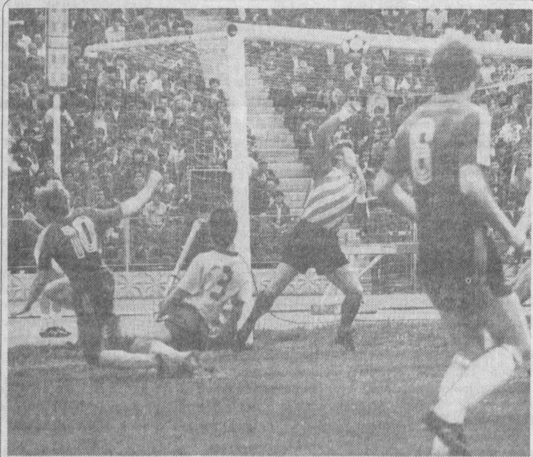
Футбол ишқибозлари орақиб қутаётган ўйингоҳларда қизгин беллашулар ўтадиган мана шундай шуксуҳли дамлар келишига ҳам оз фурсат қолди.