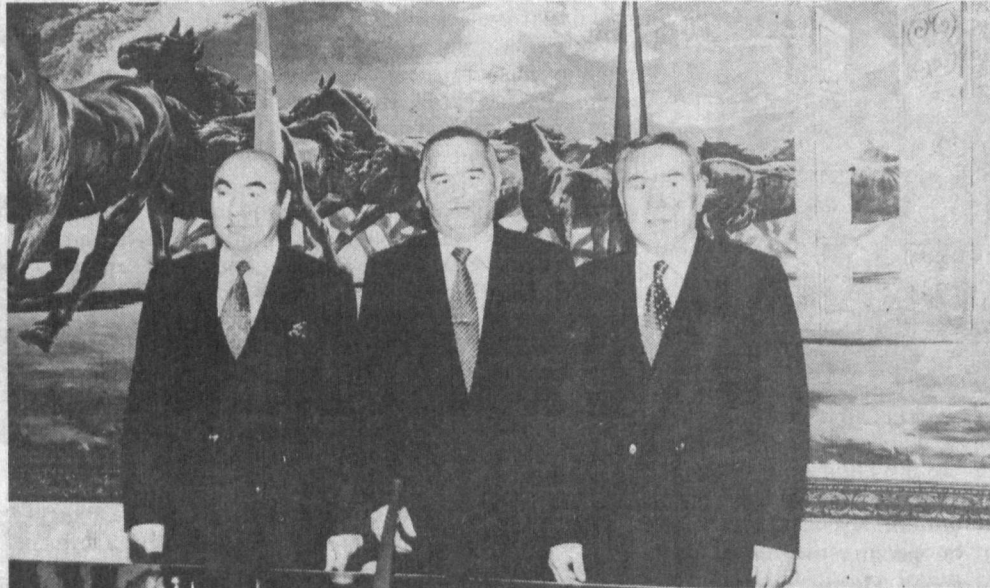
СУРАТДА: мажлис пайти.

Дастлаб Бишкекдаги «Ола арча» қароргоҳида Ўзбекистон Президенти Исло Каримов, Қирғизистон Президенти Асқар Акаев, Қозоғистон Президенти Нурсултон Назарбоев ўртасида тор доирадаги учрашув бўлиб ўтди. Сунгра ҳукумат уйининг яси заллида ўзаро музокаралар расмий делегациялар аъзолари иштирокида давом этди. Музокаралар чоғида уч қардош мамлакат ўртасида абадий дўстлик ҳақидаги шартнома лойиҳаси, давлатлараро кенгашида кузатувчининг мақоми ҳақидаги қондалар, давлатлараро кенгаш ижроия қўмитасининг ҳамда Марказий Осиё ҳамкорлик ва тараққиёт банкининг давлатлараро кенгаш қарорларини бажариш юзасидан амалга оширган ишлари ва бошқа масалалар муҳокама қилинди.