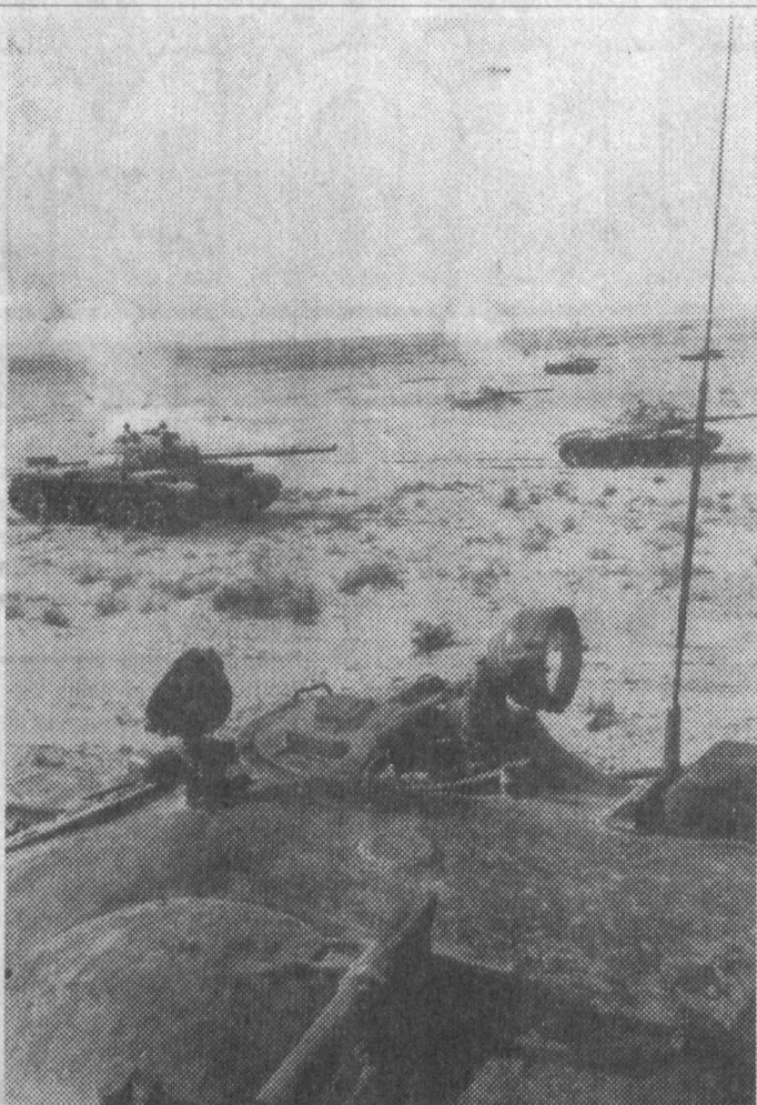
ер солиғидан тўла овоз қилинади. Аскар мактубларининг бепул юборилиши, ҳарбий хизматни тугатиб қайтган йигитларга олий ўқув юртига кириш имтиҳонлари чоғида имтиёзлар берилиши юқоридаги фикрларимизнинг далилидир.

Бу ўринда посбонларимизга кўрсатилаётган ғамхўрликларнинг айримларига, шунда ҳам асосан моддий имтиёз ва рағбатлар баён қилинди, холос. Ҳарбий хизматчилар маънавий жиҳатдан ҳам қўллаб-қувватланаётгани, бу Куролли Кучларимизнинг омма ўртасидаги маънавий янада ортишига мўҳим омил бўлаётди.