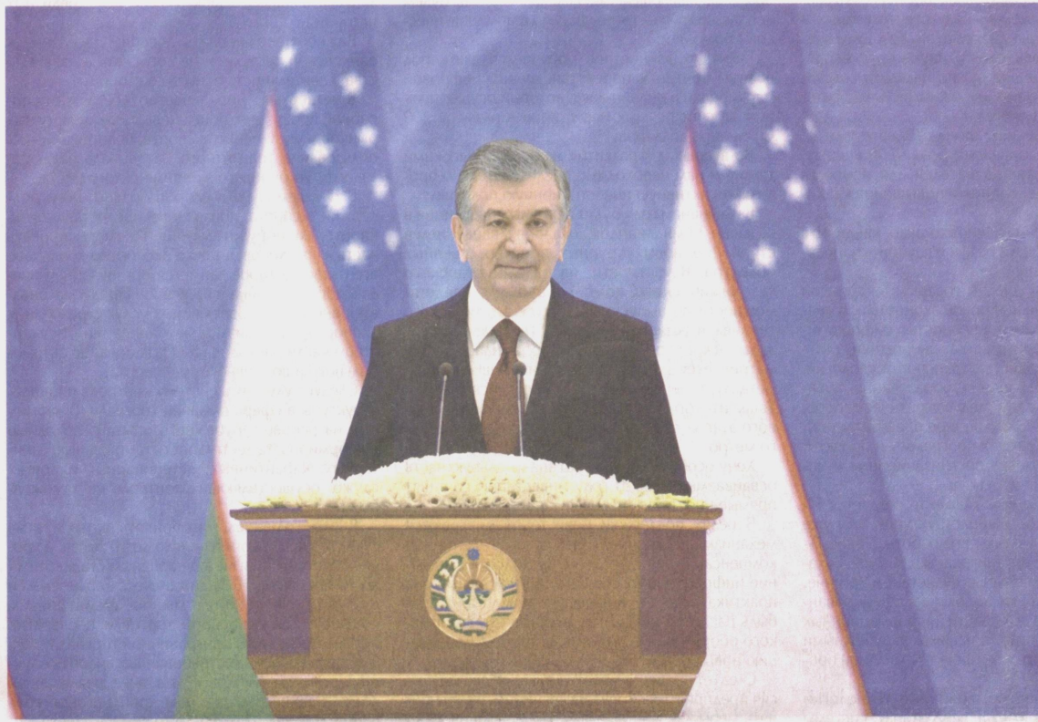
Президент Республики Узбекистан Шавкат Мирзиёев 24 января 2020 года обратился с очередным Посланием к Олий Мажлису.

В форуме, прошедшем в Международном конгресс-центре, приняли участие члены Сената Олий Мажлиса и депутаты Законодательной палаты, руководители правительства, министерств и ведомств,