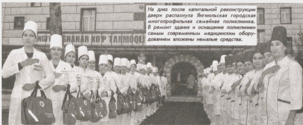
На днях после капитальной реконструкции двери распахнула Янгиюльская городская многопрофильная семейная поликлиника. В ремонт здания и оснащение поликлиники самым современным медицинским оборудованием вложены немалые средства.

Здесь будут трудиться сто высококвалифицированных врачей и 350 медицинских сестер, поликлиника рассчитана на посещение 1400 пациентов в день.