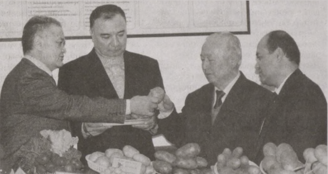
Селекция и новые перспективные сорта фруктов и овощей

Президент придает огромное значение охране здоровья граждан, реформированию системы здравоохранения, повышению качества