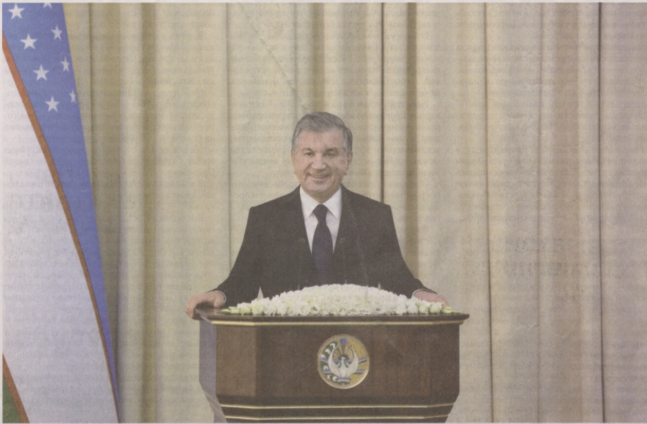
Президент Республики Узбекистан Шавкат Мирзиёев 31 января посетил научно-исследовательские институты, расположенные на улице Олимлар города Ташкента.

На этой территории действуют несколько научно-исследовательских институтов различных направлений.