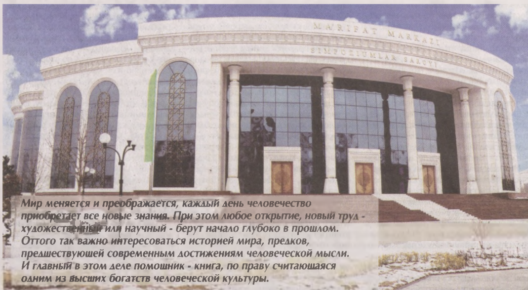
Мир меняется и преобразуется, каждый день человечество приобретает все новые знания. При этом любое открытие, новый труд - художественный или научный - берет начало глубоко в прошлом. Оттого так важно интересоваться историей мира, премков, предшествующей современным достижениям человеческой мысли. И главный в этом деле помощник - книга, по праву считающаяся одним из высших богатств человеческой культуры.

"Я скорее стану читать какое-нибудь расписание или каталог, чем не читать вообще ничего", - сказал как-то только начинающий творческий путь Сомерсет Моэм. А потом он буквально перевернул литературный мир, написав "За час до рассвета", "Острые бритвы", "Тогда и теперь", "Каталина" и еще 74 произведения. Позже он, один из самых преуспевающих прозаиков 1930-х, не раз говорил, что каждое достижение стало результатом любви к литературе, постоянного чтения книг.