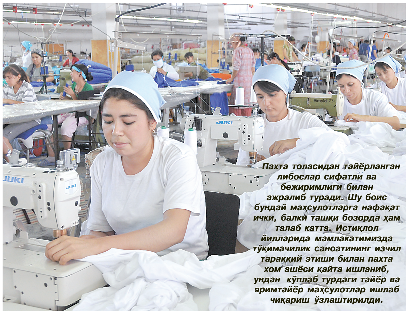
Пахта толасидан тайёрланган либослар сифатли ва бежиримлиги билан ажралиб туради. Шу боис бундай маҳсулотларга нафақат ички, балки ташқи бозорда ҳам талаб катта. Истиқлол йилларида мамлакатимизда тўқимачилик саноатининг изчил тараққиёти эшиги билан пахта хом ашёси қайта ишланиб, ундан кўплаб турдаги тайёр ва яримтайёр маҳсулотлар ишлаб чиқариш ўзлаштирилди.

ахборотга бўлган эҳтиёжларини тўлақонли қондиришга хизмат қилиши кайд этилди. Табиийки, бугунги кунда телекоммуникация ва ахборот-коммуникация технологияларининг жадал тараққиёти топиши янги хизмат турларини вужудга келтирмоқда. Бу эса истеъмолчилар, жумладан, давлат бошқаруви эҳтиёжлари ҳамда ҳуқуқ-тартиботни таъминлаш бўйича замонавий моделларнинг жорий этиш имконини яратди. Демак, тармоқда ҳужалик юритувчи субъектлар ўртасидаги муносабатлар