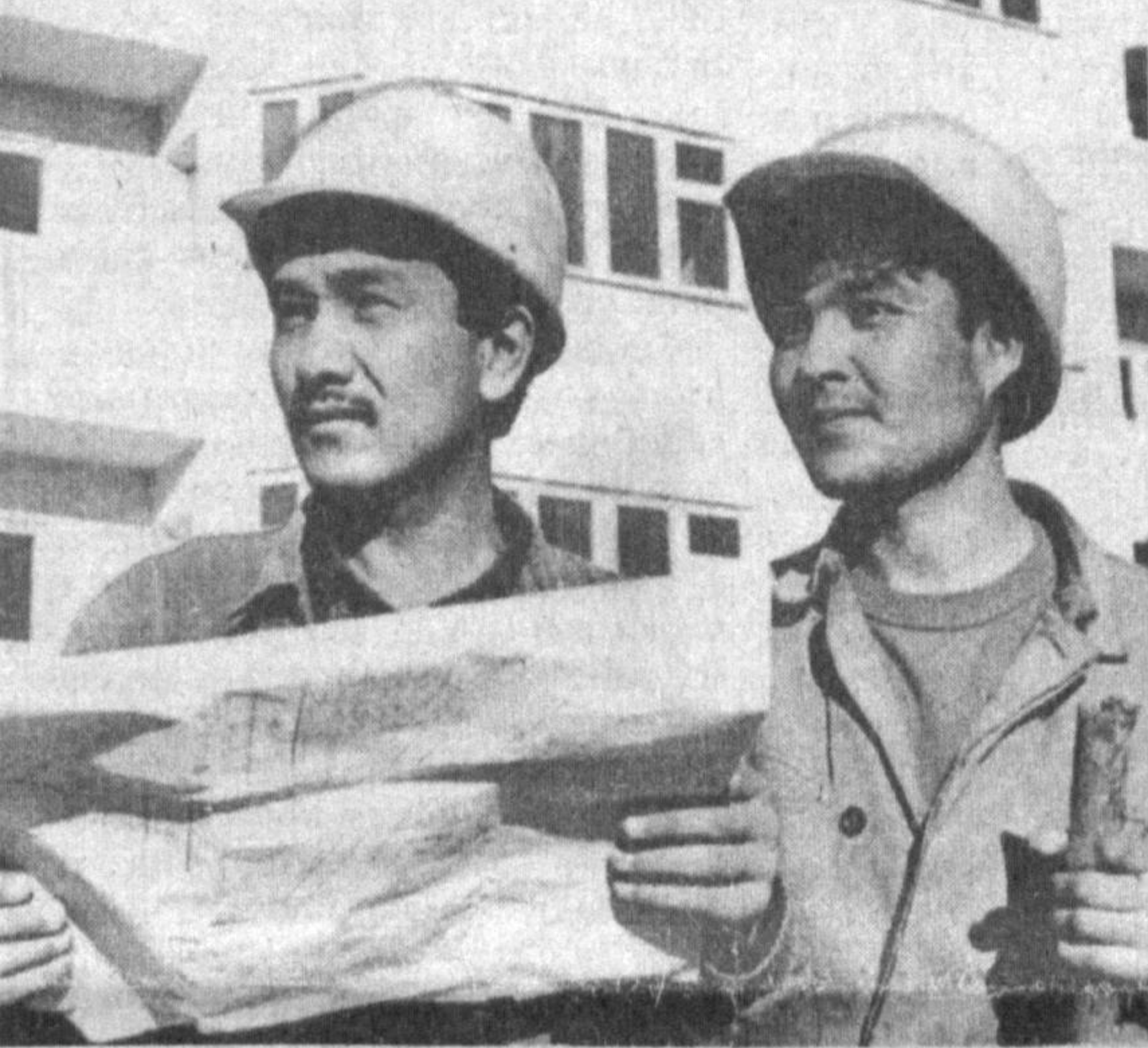
Тошкентлик кўли гул қурувчилар.