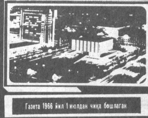
Газета 1966 йил 1 июлдан чиқа бошлаган

№ 41 (8.776) 1996 йил 8 апрель, душанба Сотувда эркин нархда